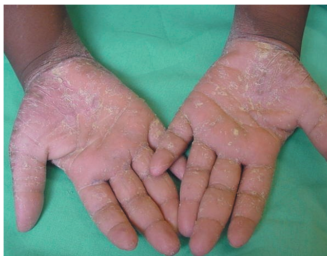
FIGURA 1: Hiperqueratose palmar bilateral com transgressão para punhos