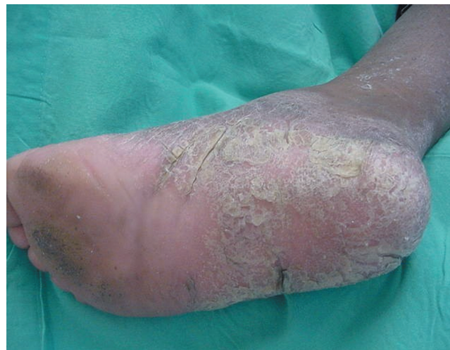
FIGURA 2: Hiperqueratose plantar

Paciente do sexo feminino, 11 anos, negra, estudante, natural e procedente de São Paulo, com queixa de lesões hiperqueratósicas e assintomáticas desde os seis meses de vida, com episódios frequentes de infecções secundárias nas mesmas. Há dois anos apresentou amolecimento e queda dos dentes. Pais consanguíneos. Exame físico geral: sem alterações. Exame dermatológico: hiperqueratose palmo-plantar acentuada (Figuras 1 e 2), com acometimento do dorso das mãos (Figura 3) e pés, e placas eritemato-queratósicas nos joelhos (Figura 4) e cotovelos. Exame odontológico: extensa perda do osso alveolar de suporte, com reabsorção horizontal e vertical das cristas, que à radiografia panorâmica da arcada dentária evidenciou alterações ditas dentes flutuantes (Figura 5). Exames laboratoriais: normais.