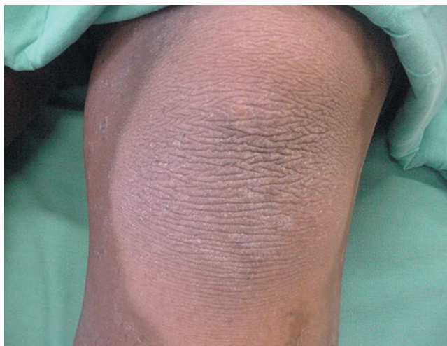
FIGURA 4: Placa queratósica no joelho esquerdo