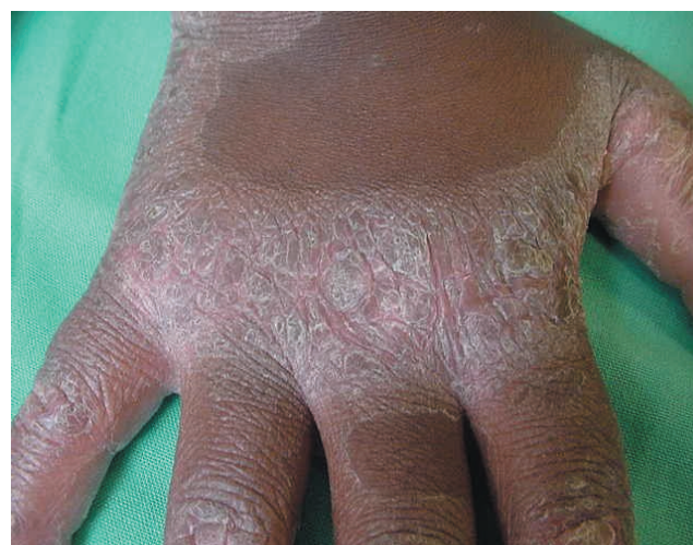
FIGURA 3: Hiperqueratose do dorso da mão direita

Aprovado pelo Conselho Editorial e aceito para publicação em 16.07.2008.