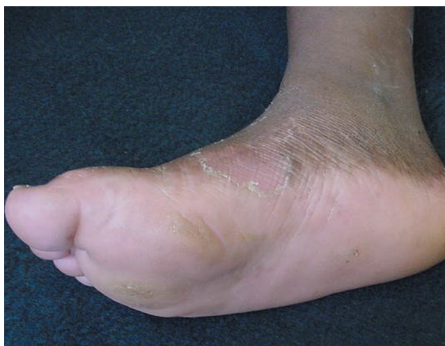
FIGURA 6: Região plantar após três meses do uso da acitretina

de antibióticos é importante no controle da periodontite ativa para preservar os dentes, mas também para prevenir bacteremias e subseqüentes abscessos hepáticos. 1