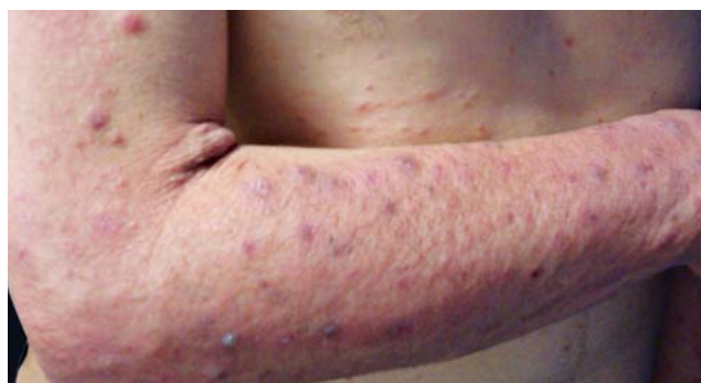
FIGURA 5: Foliculite eosinofílica. Pápulas eritematosas em antebraço

A variante infantil inicia-se entre os dois e os dez meses de vida. Apresenta lesões papulopustulosas seme-