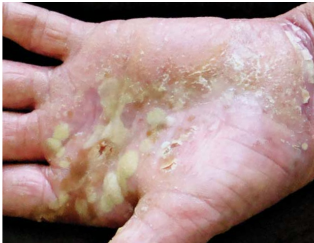
FIGURA 3: Pustulose palmoplantar. Pústulas confluentes, eritema e descamação palmares