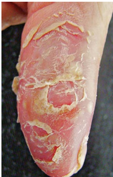
FIGURA 2: Acrodermatite contínua de Hallopeau. Fase crônica com predominio de descamação

neses. 63-65 A presença do HLA-DR9 está associada ao polimorfismo gênico dos fatores de necrose tumoral beta, com maior frequência do alelo tipo 2 nos pacientes com PPP. 65 Não se observou associação com o gene do TNFA. 66 Variações nos genes que determinam a subfamília das citocinas da interleucina 19 (IL-19) poderiam influenciar a susceptibilidade à pustulose palmoplantar. 67