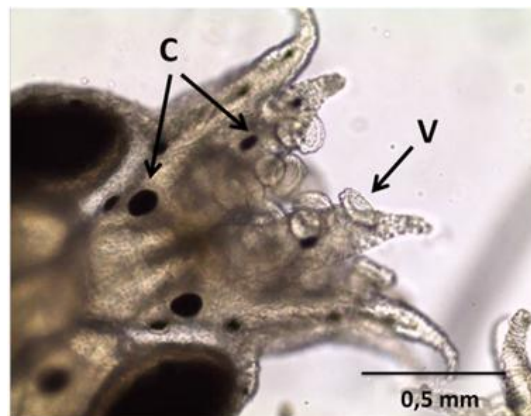
Figura 2. Paralarva de Octopus vulgaris Tipo II aos três dias de idade. V: ventosas, C: cromatóforos.

e artêmias cultivadas com I. galbana e enriquecidas com Nannochloropsis sp.