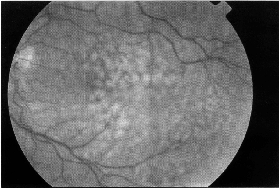
Fig. 3. - Aspecto moteado do polo posterior decorrente do tratamento pós radioterápico.

ração amarelada e ocorrem, preferencialmente, na região macular. Dos 16 olhos acometidos neste estudo, apenas 01 caso apresentou comprometimento da íris e corpo ciliar, sem lesão no pólo posterior. Entretanto, em 09 casos, houve infiltração tumoral da cabeça do nervo óptico. Não existem dados relacionando o comprometimento do nervo óptico com um pior prognóstico ocular ou sistêmico.