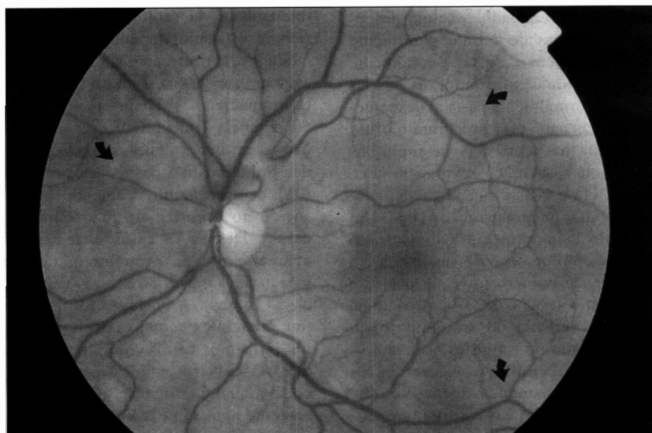
Fig. 2. - Fotografia do polo posterior do olho esquerdo da paciente nº 9. Presença de lesões nodulares nas arcadas (Fotografia da primeira semana de sintomatologia. A paciente não relatou sintomas neste olho).