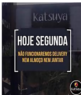
Imagem 3 – Katsuyasushi