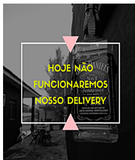
Imagem 2 – Beer Garden

classificado como verbo intransitivo (FERNANDES, 2003; LUFT, 2003; BORBA, 2002), é recrutado pela construção transitiva: