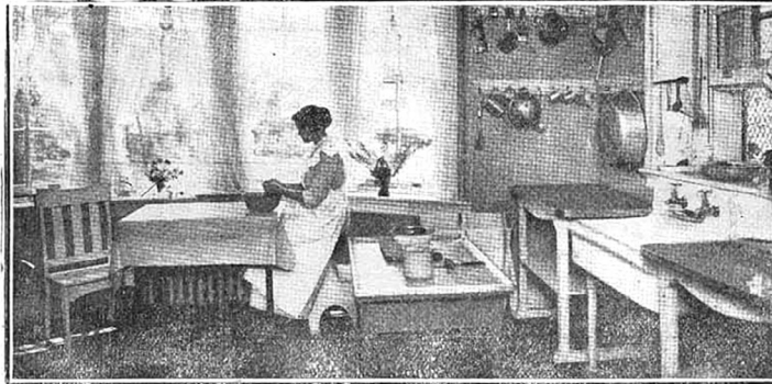
A cozinha é um lugar hygienico, escrupulosamente asseado, pratico até ao exaggero, commodo, muito commodo, tanto quanto permittam as circumstancias.

Um detalhe que merece attenção é o assento. Uma cadeira commum não serve, por causa do espaldar. O melhor é uma banqueta alta, que permitta á cozinheira estar sentada enquanto prepara as salsas ou descasca as batatas, servindo-lhe tambem para approximal-a do fogão de gaz, segundo os casos. Advirta-se