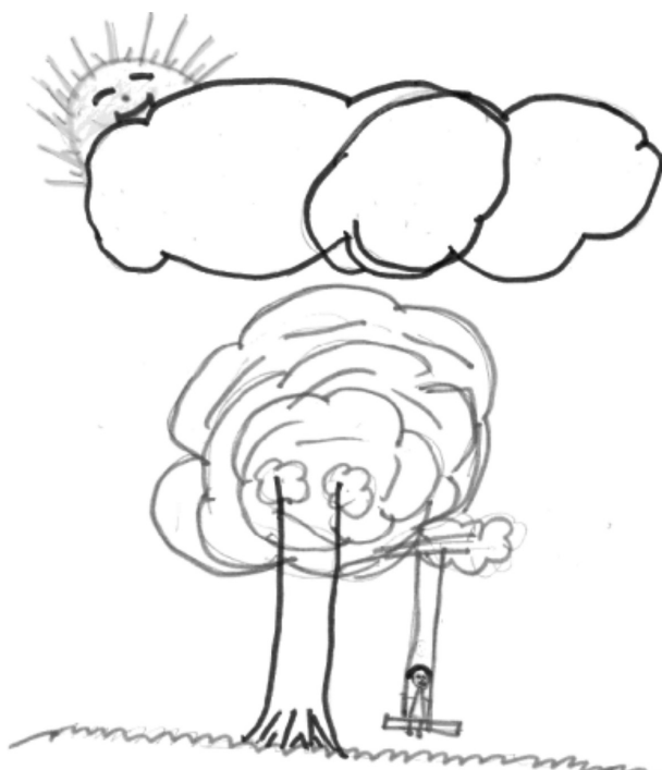
Desenho 3. Representa a gente vê um ar melhor, porque depois que essas indústrias chegarem, a gente não vai respirar o ar que a gente respirava antes. (Jovem G)

Novamente, remete-se à saúde ambiental como aquela sem interferência do homem, destacando a problemática por eles vivenciada e percebendo as possíveis implicações que poderão ocorrer.