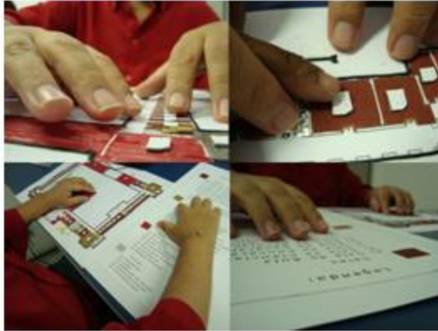
Figura 4 - Mosaico de fotos da análise da representação do vidente.

As orientações cartográficas utilizadas nessa pesquisa são a rosa dos ventos utilizada nos mapas do Instituto Benjamin Constant e a utilizada pelo Labtate (UFSC).