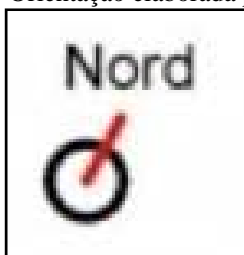
Figura 1 – Orientação elaborada pela ONCE

No Canadá, a pesquisa sobre cartografia tátil está bem avançada. O governo do Canadá disponibiliza na internet, inúmeros mapas para download . A orientação utilizada nos mapas canadenses é de um formato circular com a indicação da letra N indicando a palavra norte (no interior do círculo). Todavia como critério de análise,