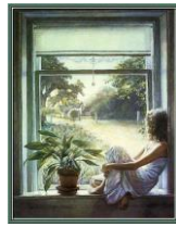
Figura 2 La niña