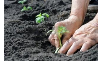
Figura 4 La puesta de sol

El Cuadro 1 muestra posibles historias de los alumnos frente a las imágenes: