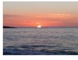
Figura 3 Plantación de porotos