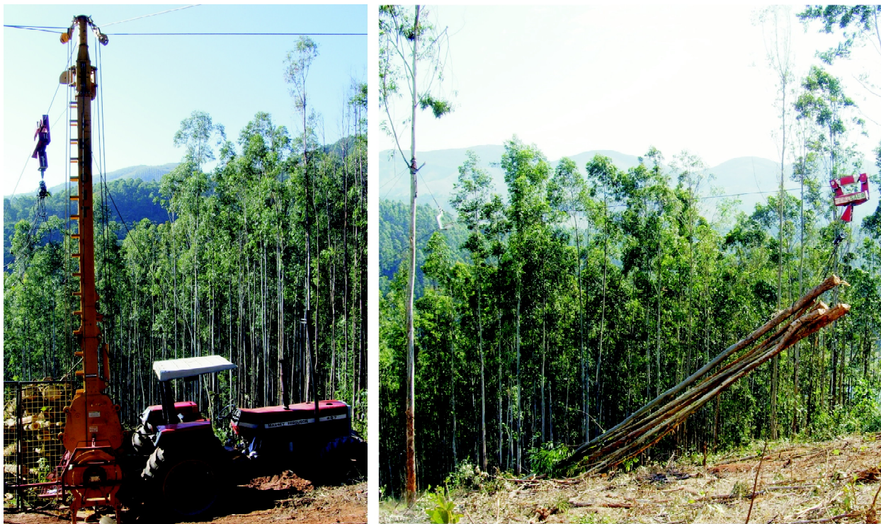
Figura 1 – Vista geral do cabo aéreo.

O cabo aéreo empregado no estudo é da marca Penzsaur , equipado com 4 estropos, executado por uma torre, que foi instalada na parte mais alta do morro, acoplada à parte traseira do trator agrícola ligado à tomada de potência (Figura 1).