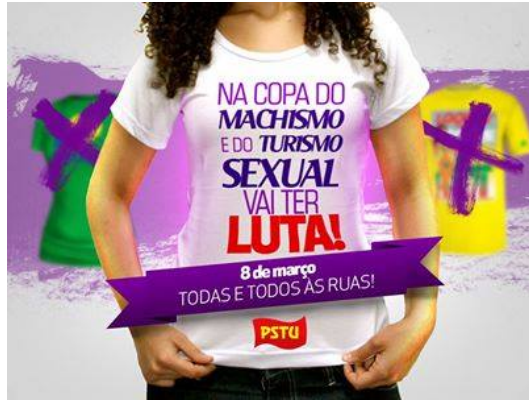
Imagem difundida pelo PSTU (Partido Socialista dos Trabalhadores Unificado), fazendo uma chamada para a comemoração do Dia Internacional da Mulher de 2014.