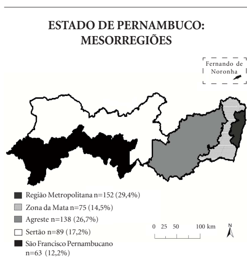
Figura 2. Distribuição espacial das mortes devido a acidentes com ciclistas/bicicletistas, Pernambuco, 2001-2010.

informada” prejudica a entrada de dados no SIM e o diagnóstico preciso deste agravo.