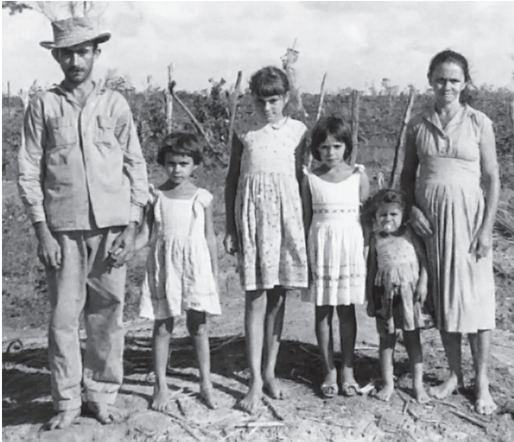
Família sertaneja típica, à beira de estrada, em períodos de secas.