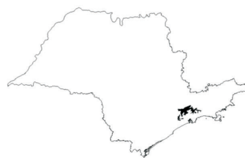
Localização do Aquífero São Paulo no Estado