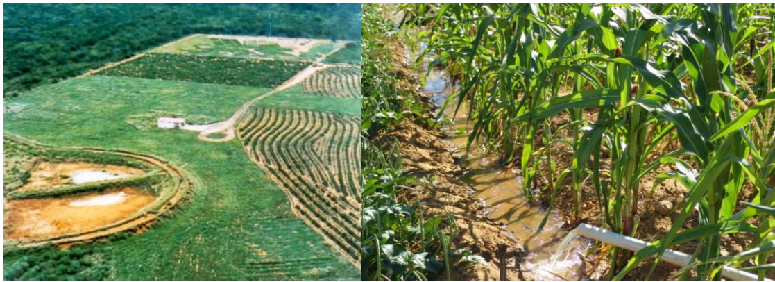
FIGURA 1. Barragem para armazenamento da água de chuva para uso na irrigação de salvação. Dam to store rainwater for use in the salvation irrigation.

Entre as culturas de subsistência do Nordeste brasileiro, o feijão-vigna ( Vigna unguiculata (L.) Walp.), também conhecido como feijão-macassar ou feijão-de-corda, é uma das variedades mais consumidas. Da mesma forma, o milho ( Zea mays L.) também é extensivamente utilizado como alimento humano, devido às suas qualidades nutricionais.