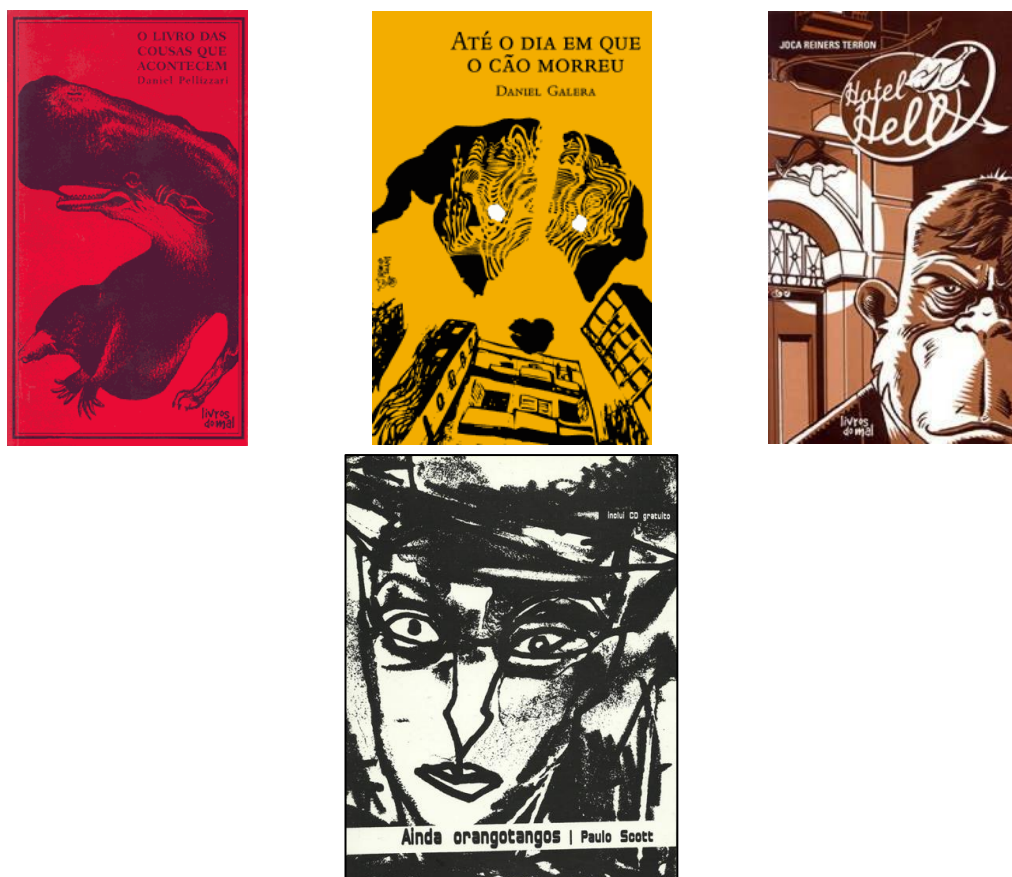
Figura 5 – Capas dos livros da Coleção Tumba do Cânone.

Para essa coleção, cada autor convidou um ilustrador para ser responsável pela arte de seu título. A qualidade e o resultado estético dessas publicações (Figura 5), que buscavam se distinguir do padrão editorial vigente, foi reconhecida pela crítica como um ponto forte da editora.