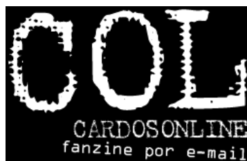
Figura 2 – Logomarca do COL – Cardosonline