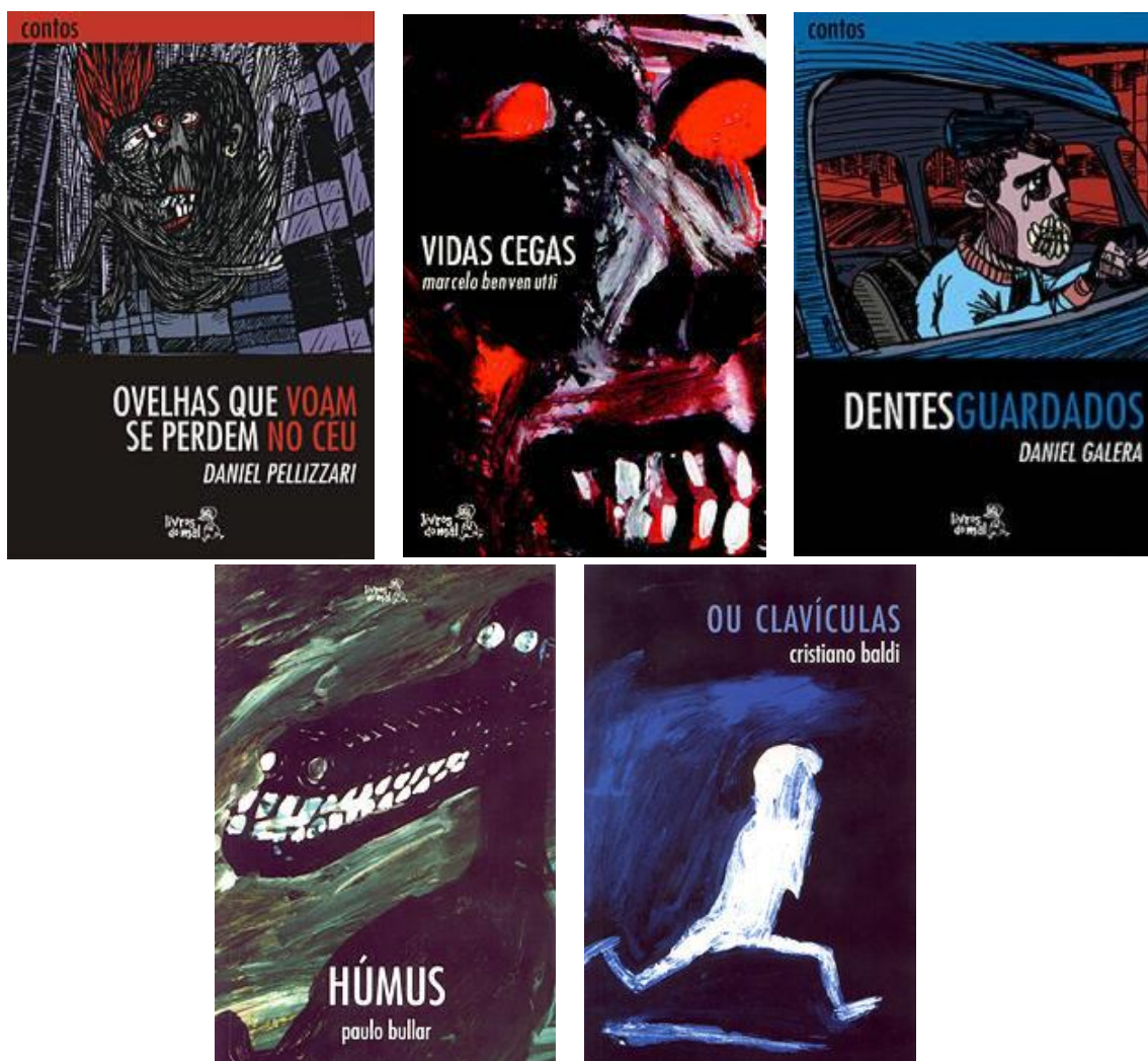
Figura 4 – Capas dos livros da Coleção Contra a Capa.