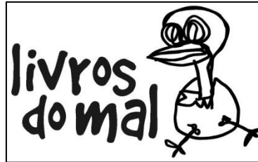
Figura 1 - Logomarca da Editora LdM, criado por Guilherme Pilla

nebuloso da internet e, de certa forma, foi reconhecida como uma renovação no perfil da literatura contemporânea nacional.