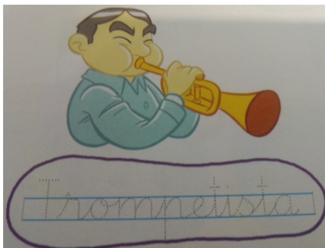
Figura 2- Representación masculina de trompetista