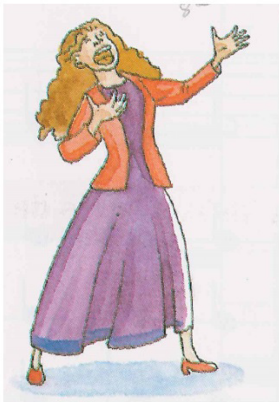
Figura 1- Representación femenina de cantante