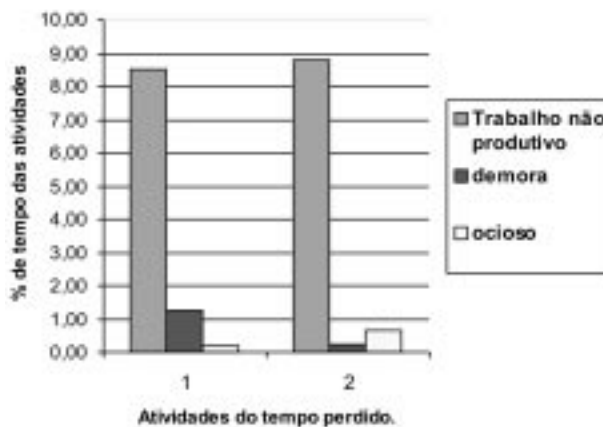
Figura 3. Representação das atividades que configuraram o tempo perdido.

As atividades não produtivas das serras (I e II) foram separadas, e representadas na Figura 10. Detalhando cada uma destas, observou-se que as principais atividades do trabalho não produtivo foram em ordem decrescente de ocorrência: trocas de serra, trocas de óleo, ajuste da guia e problemas no carro porta-toras. As da demora foram: acúmulo de pranchões na esteira e acúmulo de resíduos na esteira coletora de resíduos. A falta de matéria-prima constituiu o tempo ocioso. Isso foi decorrente aos atrasos no carregamento das toras e falhas no sistema de transporte das mesmas.