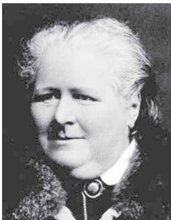
Figura 1: Frances Power Cobbe (1822-1904) reunia características um tanto peculiares. Por um lado, era uma ativista dos direitos das mulheres e dos interesses dos animais; por outro, foi uma opositora fervorosa do processo de secularização que vinha a reboque do programa de pesquisa darwinista, e seu discurso ético era de fundamentação teológica, com não poucas alusões à ideia de pecado