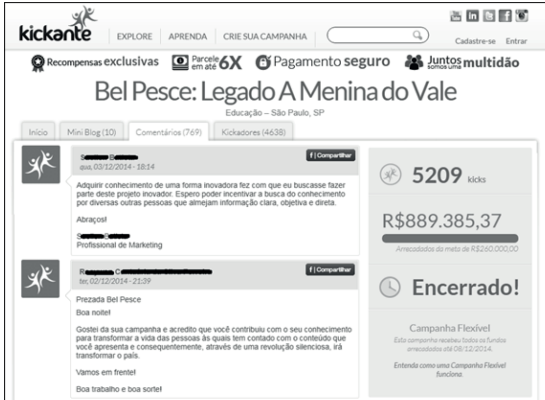
Figura 2 – Comentários estabelecidos em um projeto na plataforma crowdfunding