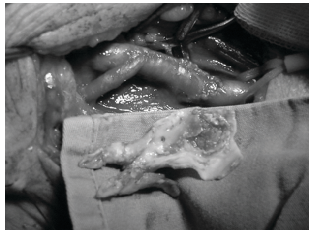
Figura 4 - Resultado após endarterectomia por eversão e reimplante da artéria carótida interna (aspecto da placa removida)

A presença de estenose distal da artéria carótida interna é uma situação pouco freqüente, podendo ser detectada em menos de 5% dos casos operados 29 . Atualmente, está sendo postulada como uma indicação para o tratamento endovascular, pois a ECA resultaria em maior incidência de lesão de nervos cranianos 30 . Para evitar esse problema, temos utilizado a técnica do acesso convencional e o controle intraluminal do refluxo, com um cateter de Fogarty colocado em posição distal. Assim, há condições de uma dissecação alta da placa e sua conseqüente remoção, com bom resultado. Outras