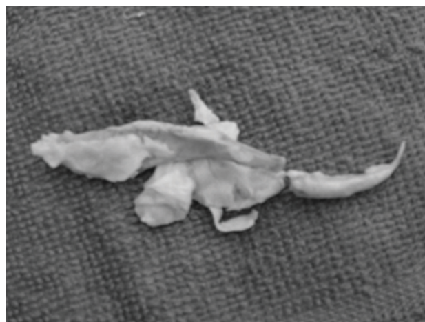
Figura 2 - Placa removida de paciente submetido a endarterectomia incompleta prévia

indicação cirúrgica pode também ser bem defendida, se executada por cirurgião experiente, pois o grau de exigência técnica é maior.