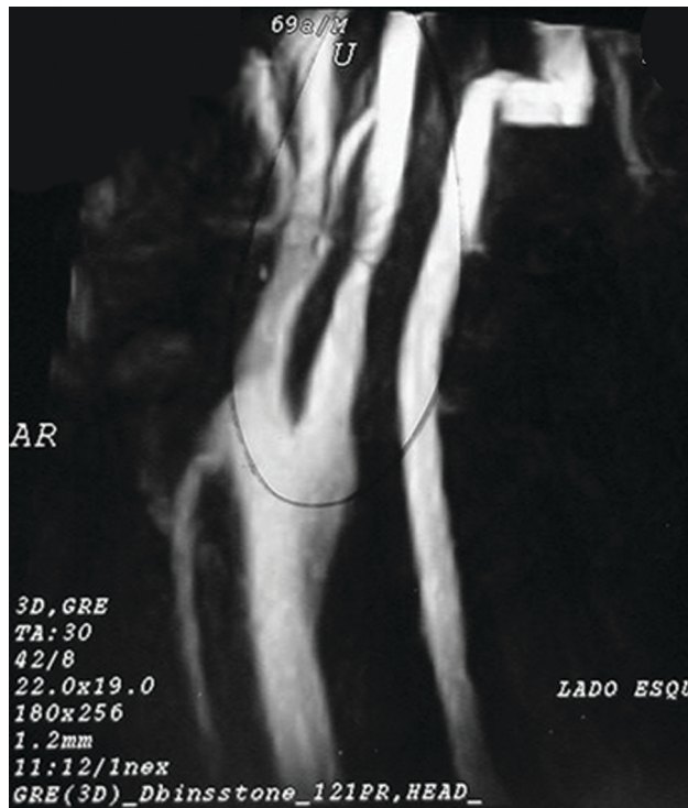
Figura 1 - Estenose residual em paciente operado há 30 dias

A placa aterosclerótica recorrente costuma ter apresentação tardia (geralmente após 5 anos da cirurgia). Pode localizar-se na própria área já endarterectomizada, na porção proximal à endarterectomia da carótida comum ou na porção distal da arteriorrafia. Essa tem sido uma das indicações para o tratamento endovascular, mas deve ser considerado que, na lesão arteriorrafia recidivada, a