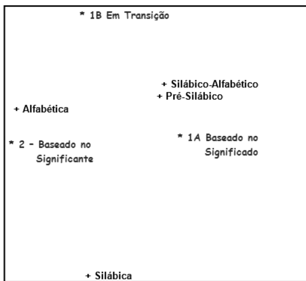
Figura 3. HOMALS. Relação de homogeneidade entre o nível de escrita e realismo nominal

Conforme indicado, os sujeitos que estavam no nível 1A do realismo nominal obtiveram menos sucesso na tarefa de leitura, lendo de forma não convencional ou segmentada. Diferentemente, os que se encontravam em fase de transição (1B) evoluíram para uma decodificação