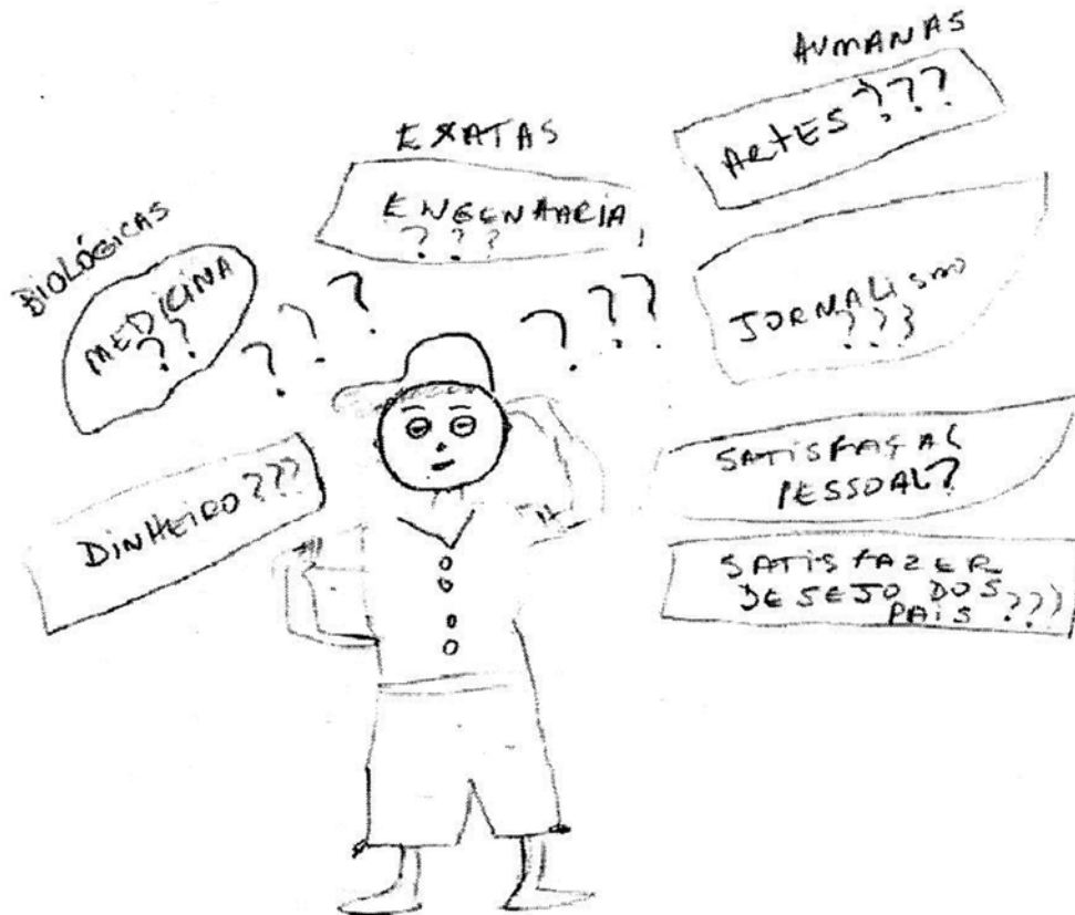
Figura 2. Tudo que seu mestre mandar.

...Joãozinho, então com 17 anos, precisa decidir [sobre] o que escolher para fazer durante o resto de sua vida. Gosta de matemática, então pensa em fazer Engenharia, mas também adora participar do jornalzinho de sua escola, escrevendo artigos. E tem também as aulas de violão que João adora; até pensou em seguir a carreira de músico, a qual seus pais não concordam, pois, segundo eles, não traz retorno financeiro.