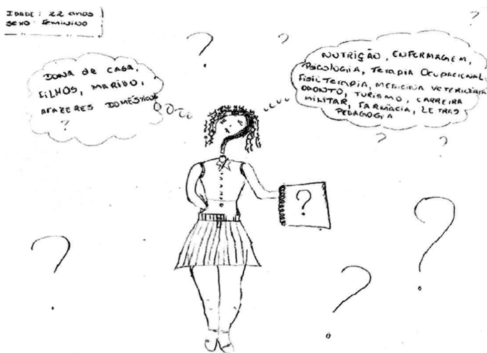
Figura 1. Ser ou não ser?

O campo da indecisão é o mais frequente e se manifesta nas produções em que o jovem aparece ansioso, oscilando entre vários caminhos, ora muito infantilizado ora extremamente angustiado frente à tarefa de integrar desejos que encara como opostos. Nas palavras de uma aluna: "Essa adolescente está no seu inferno astral, na