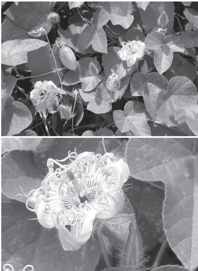
Fig.1. Passiflora foetida encontrada no município de Patos, PB.

TERMOS DE INDEXAÇÃO: Plantas tóxicas, Passiflora foetida , Passifloraceae, intoxicação por planta, plantas cianogênicas, cianeto, caprinos.