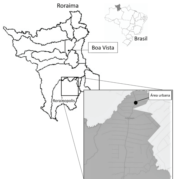
Fig.1. Mapa do município de Rorainópolis, Estado de Roraima, com destaque para a região nordeste ao longo da Rodovia BR-147 e vicinais onde foram realizadas as coletas de equinos.

O município de Rorainópolis (00°56'45" Norte e 60°25'04" Oeste) situa-se na região sul de Roraima, distante 290 quilômetros da capital Boa Vista (Fig.1). No município predomina o clima quente, com chuvas no verão e outono, temperatura média anual de 26°C e precipitação pluviométrica de 1.750mm. Na região nordeste do município o clima é equatorial com estação seca (Roraima 2014). Dados censitários de 2012 demonstram que a população de equinos no município foi estimada em 1426 animais (IBGE 2012). O número de equinos analisado foi calculado pelo programa EpiInfo 7.0 (CDC-Atlanta), considerando estimativa de prevalência de 50%, erro de 5% e confiança de 95%. Para compor o estudo, foram sorteadas propriedades presentes ao longo da BR-174 e estradas vicinais.