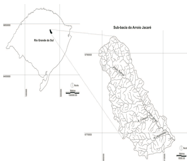
Figura 1 – Localização da sub-bacia do Arroio Jacaré, Vale do Taquari, RS.

Figure 1 – Location of Jacaré stream sub-basin, Taquari valley, RS.