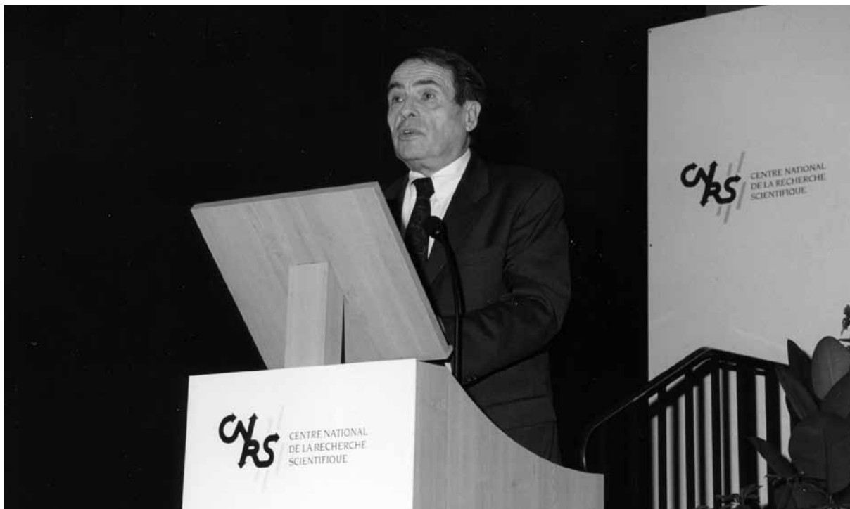
Figura 3 Bourdieu Fazendo seu Discurso.

O discurso de Bourdieu na aceitação da Medalha de Ouro do CNRS e o desenrolar da cerimônia em que ele o leu, com uma voz hesitante que foi ganhando volume no cavernoso silêncio que o envolvia, apresenta um triplo interesse para a história e a sociologia da sociologia. Em primeiro lugar,