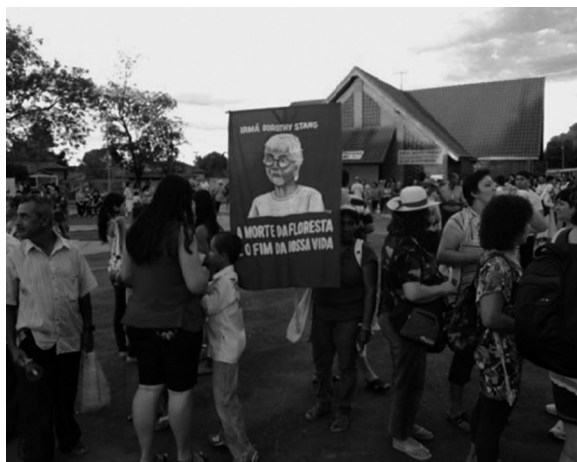
Peregrinos e romeiros na praça central de Ribeirão Cascalheira. Em destaque, as imagens de padre Josimo (assassinado em 1986) e Dorothy Stang (assassinada em 2005).