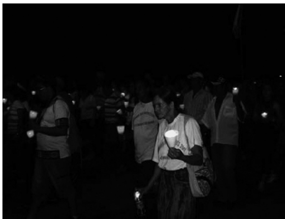
Peregrinos e romeiros na Romaria dos Mártires da Caminhada, Ribeirão Cascalheira (MT).

de elaboração da sacralização dos mártires através da partilha de suas histórias. Numa dessas noites registramos a acolhida dos romeiros na capela que teria sido onde o padre João Bosco recebeu os primeiros socorros antes de ser levado para a cidade de Goiânia e falecer. Os momentos que precedem o ritual são marcados por cantos, danças e exposição de imagens que contribuem na montagem expressiva das narrativas sobre as histórias dos líderes magnificados.