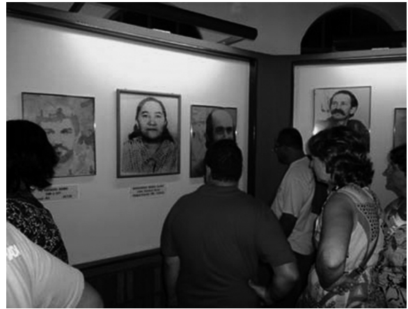
Concentração de romeiros na Galeria dos Mártires da América Latina, em Ribeirão Cascalheira (MT).