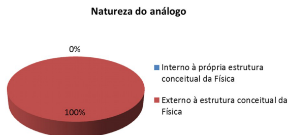
Figura 1 - Gráfico indicativo da distribuição das analogias quanto à natureza do análogo.

analogias criadas pelos alunos são externos ao domínio da física , ou seja, são análogos com origem no cotidiano desses alunos, em situações que eles vivenciam e experimentam em suas vidas (Fig. 1). Essa constatação é bastante diferente da que obtivemos quando analisamos, por exemplo, livros didáticos de física [39], nos quais as analogias apresentadas pelos autores, em geral, utilizam análogos internos à estrutura conceitual da física.