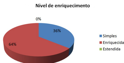
Figura 5 - Gráfico indicativo da distribuição das apresentações analógicas quanto ao nível de enriquecimento.

sentações essas relações analógicas, ou seja, que teve dificuldades nessa tarefa, conforme gráfico da Fig. 5. Alguns alunos chegaram a citar elementos de seu análogo (pessoas, movimento das pessoas, etc.), mas não estabeleceram correspondência desses elementos com o conceito de energia interna. Isso demonstra claramente uma dificuldade na exploração das analogias produzidas por eles. Nas apresentações em que esta tarefa foi cumprida (64% de apresentações enriquecidas ) a maioria das correspondências estabelecidas entre os elementos do conceito de energia interna e os elementos do análogo utilizado refere-se aos átomos , relacionados com pessoas, grãos de lentilha, formigas, alunos, etc.; sistema com gás , relacionado com boate, balada, escola, ônibus, formigueiro, sala de aula, etc.; movimento dos átomos , relacionado ao movimento dos elementos que foram comparados aos átomos; fornecimento de energia, na forma de calor , relacionado ao tipo de música que toca na festa, ao horário de recreio na escola, à troca de período (aula) na escola, etc.