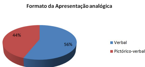
Figura 4 - Gráfico indicativo da distribuição das apresentações analógicas quanto ao seu formato.

Na turma A, em que não foi dada instrução para elaboração de figuras do análogo, os alunos não utilizaram espontaneamente nenhum tipo de representação em forma de figuras (56% de apresentações analógicas verbais , conforme gráfico da Fig. 4).