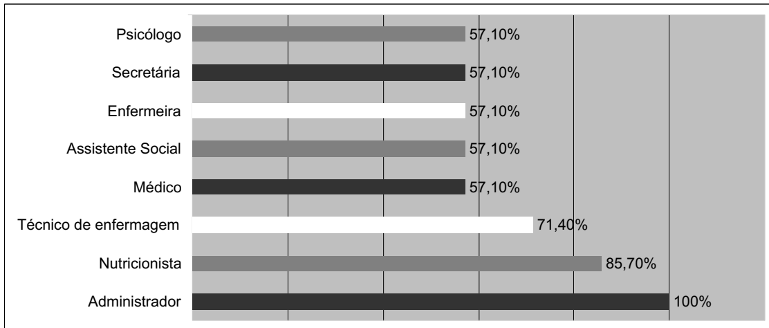
Gráfico 2 - Frequência dos profissionais das instituições de longa permanência para idosos - Olinda, 2009.

*NOTA:1-Os resultados abrangem mais de uma resposta por instituição