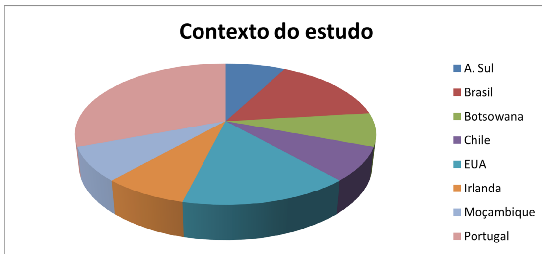
Figura 2 – Caracterização dos estudos de acordo ao contexto do estudo