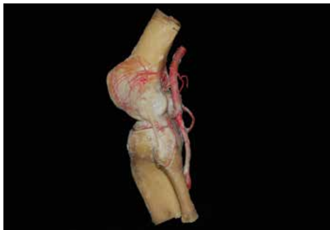
Figura 3 – Vista lateral do joelho dissecado após aplicação de contraste pela artéria femoral para mensuração da distância entre o túnel femoral e as estruturas do côndilo femoral lateral: a artéria genicular lateral superior e a inserção proximal do ligamento colateral lateral.