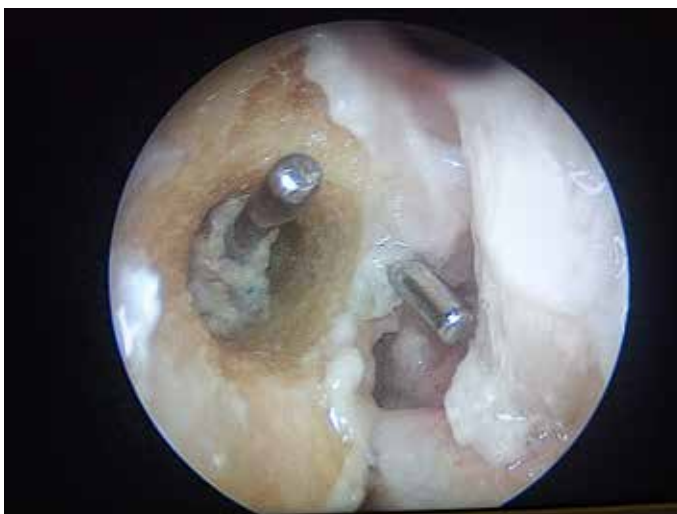
Figura 1 – Vista artroscópica do túnel femoral com uso de técnica transportal e com uso de técnica transtibial.

As medidas da distância do túnel femoral até a inserção proximal do ligamento colateral lateral e a distância do túnel femoral até o ramo principal da artéria genicular lateral superior foram realizadas e comparadas entre as diferentes técnicas estudadas para reconstrução do LCA.