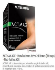
Peça 02 (folder)