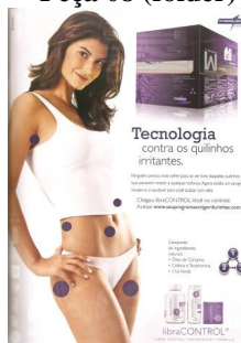
Peça 08 (folder)