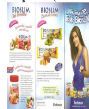
Peça 03 (folder)