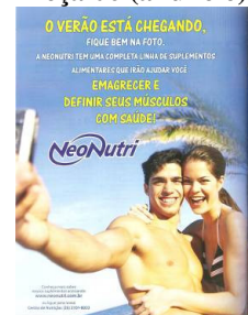
Peça 06 (anúncio)