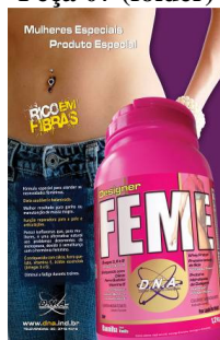
Peça 07 (folder)