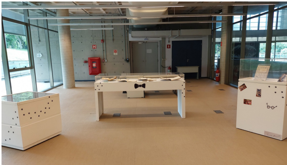
Figura 4 – Sala de consulta da Biblioteca com mobiliário para mostra dos livros.

Para essa mostra foram utilizados os livros originais colocados em mobiliário expositivo na sala de consulta da Biblioteca. Inspiradas em Tout-Petit (cujo codinome era “Yogui”) e Xizinha (cujo sobrenome era “de Keran”), gatos de Guimarães que acompanharam a feitura de seus livros, pequenas patas, sinalizando a caminhada de felinos pelos móveis expositores, conduziram as pessoas para o universo de admiração que Guimarães possuía pelos animais.