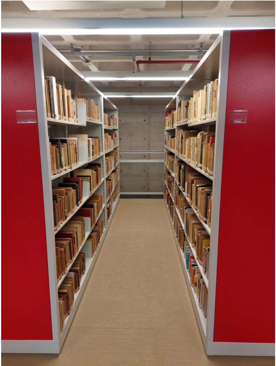
Figura 8 – Estantes da Reserva Técnica da Biblioteca do IEB – parte dos livros que pertenceram a Guimarães Rosa.

Os livros de coleções especiais, como é o caso da Coleção João Guimarães Rosa da Biblioteca do IEB, possibilitam por meio das dedicatórias estabelecer a rede de relações sociais de um indivíduo, como também as particularidades dessas relações. As marcações feitas nos livros e anotações em suas margens muitas vezes estão