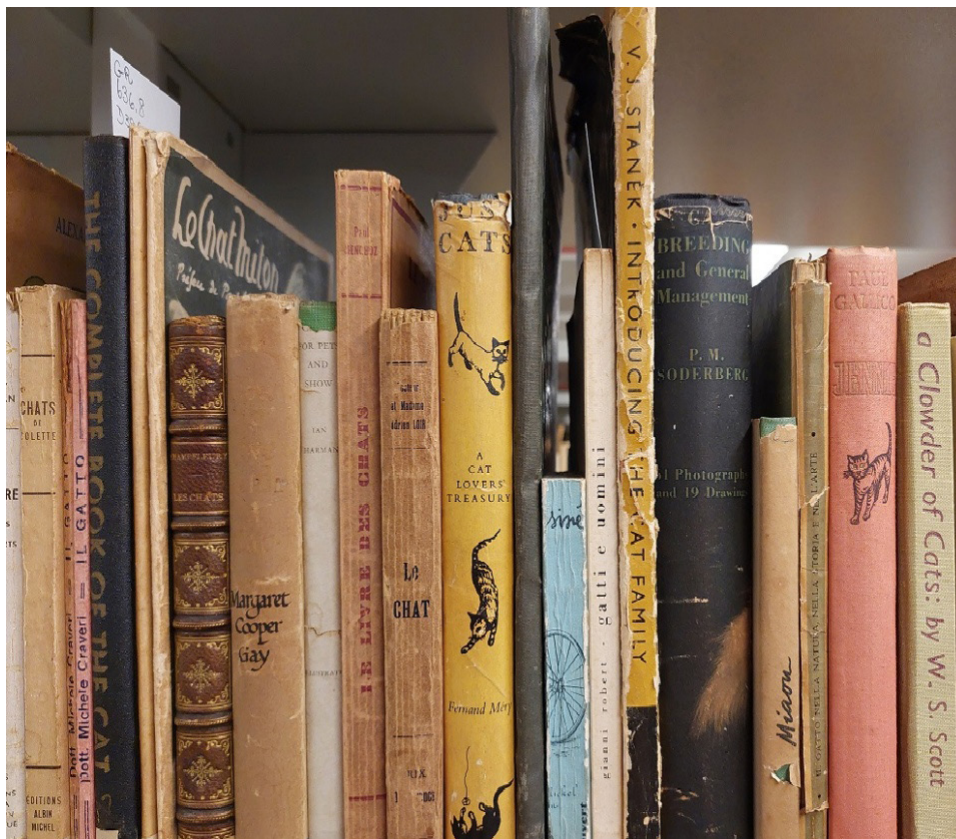
Figura 7 – Obras da Coleção João Guimarães Rosa relacionadas a felinos na Reserva Técnica.