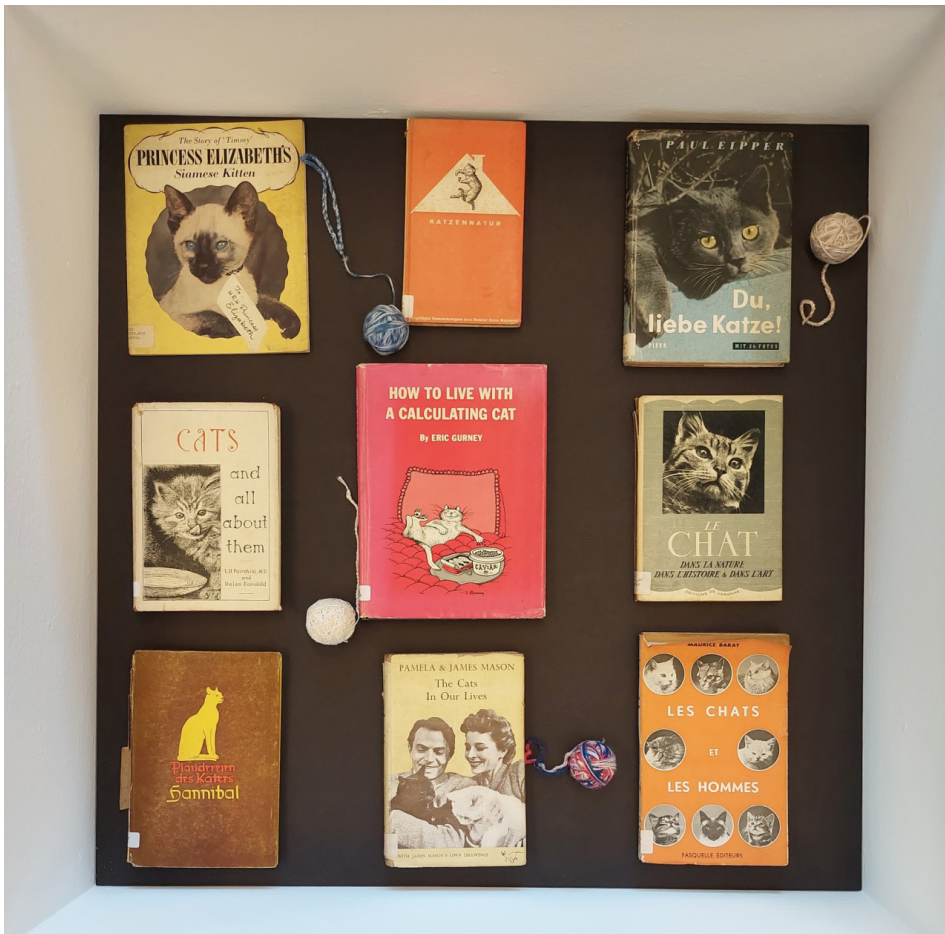
Figura 5 – Mobiliário expositivo com alguns dos livros sobre gatos em línguas como inglês, francês, alemão e italiano.

O livro Ooó do vovô também recebeu destaque, pois reúne correspondências de Guimarães com as netas, estando as figuras dos bichanos presentes em cartões-postais e nas mensagens do escritor: “Este é o gato. Da estória do gato. Vovô conta a história, quando você vier ao Rio para o Natal...” (ROSA, 2003).