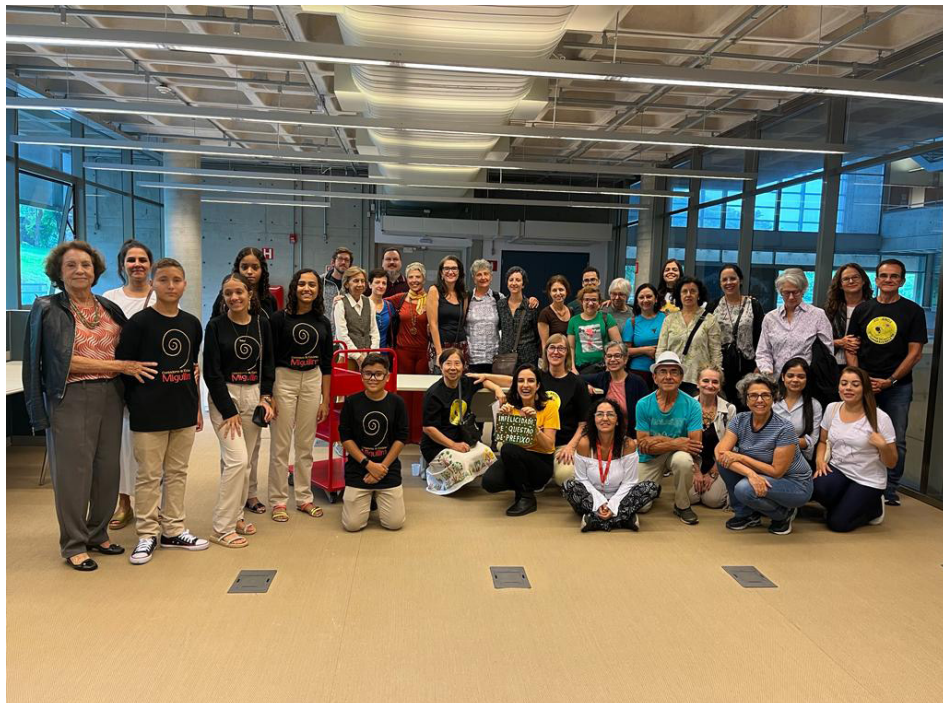
Figura 6 – Visita de participantes da Roda de Leitura Guimarães Rosa e de integrantes do Grupo Miguilim (Cordisburgo – MG).

Outras obras relacionadas a gatos que não integraram a mostra e também possuem dedicatórias e partes sublinhadas permaneceram na área da Reserva Técnica, junto de outras classificadas na temática de animais, assunto caro ao escritor mineiro.