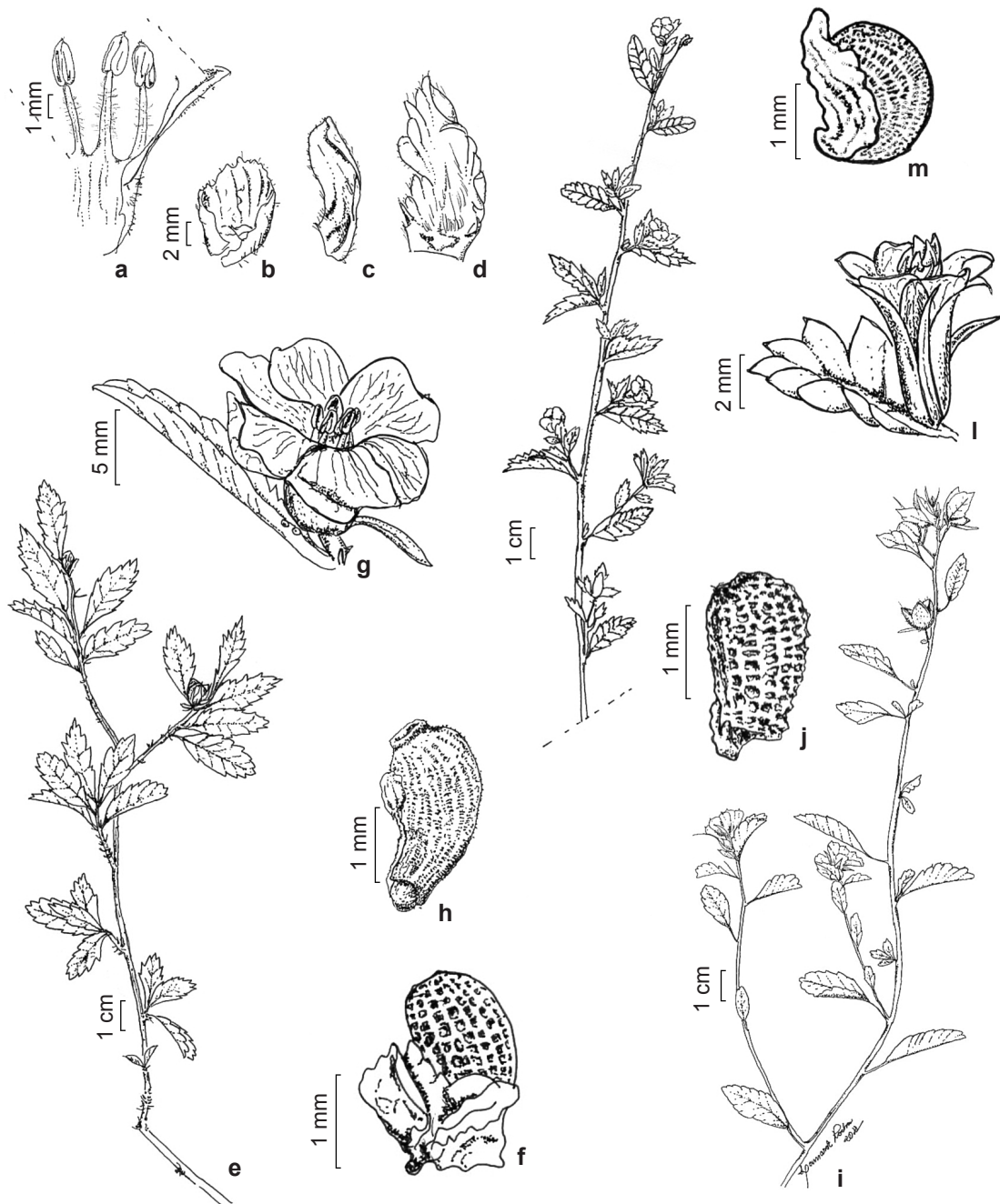
Figura 2 – a-d. Turnera blanchetiana (I.N.G. Rocha 294) – a. estames evidenciando as margens adnatas; b. bráctea inferior; c-d. bracteolas. e-f. T. calyptrocarpa (I.N.G. Rocha 293) – e. ramo frutífero; f. semente. g-h. T. cearensis (I.N.G. Rocha 259) – g. flor brevistyla; h. semente. i-j. T. chamaedrifolia (O.F. Oliveira 1577) – i. ramo florífero; j. semente. k-m. T. diffusa (G.B.C. Paterno & M.I.B. Loiola 160) – k. ramo florífero; l. flor brevistyla; m. semente. Figure 2 – a-d. Turnera blanchetiana (I.N.G. Rocha 294) – a. stamens showing adnated margin; b. lower bract; c-d. bracteoles. e-f. T. calyptrocarpa (I.N.G. Rocha 293) – e. fruit branch; f. seed. g-h. T. cearensis (I.N.G. Rocha 259) – g. flower brevistylous; h. seed. i-j. T. chamaedrifolia (O.F. Oliveira 1577) – i. fertile branch; j. seed. k-m. T. diffusa (G.B.C. Paterno & M.I.B. Loiola 160) – k. fertile branch; l. flower brevistylous; m. seed.