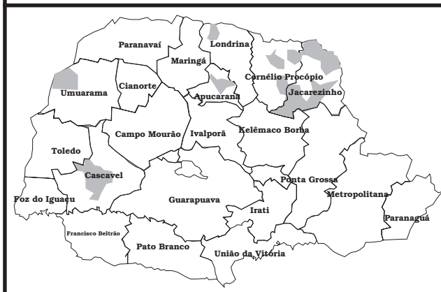
Figura 1C - Loxosceles gauch