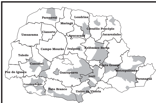
Figura 1A - Loxosceles intermedia

de distribuição para o Paraná (Curitiba) 15 , uma vez que Fischer 4 revisando o material tombado na coleção do Museu de História Natural Capão da Imbuía constatou se tratar de L. laeta e L. intermedia . Após esse registro, a espécie não foi mais notificada para o estado. Resultado semelhante foi obtido por Backup 2 para o Rio Grande do Sul, onde a ocorrência da espécie não foi confirmada. A partir de 1996 foram recebidos na coleção do CPPI dois machos, provenientes de Cascavel (1996/1998) e uma fêmea, proveniente de Telêmaco Borba (1998). Em outubro de 1998, 17 indivíduos (5 machos, 9 fêmeas e 3 jovens) foram coletados intra e peridomiciliariamente em edificações na Usina Hidrelétrica Julio de Mesquita Filho, no município de Cruzeiro do Iguaçu. Em junho de 1999, cinco indivíduos (3 machos, 1 fêmea e 1 jovem) foram coletados em um depósito e em entulhos, na vila de moradores da Usina Hidrelétrica de Salto Osório, município de Quedas do Iguaçu. Nestes mesmos ambientes foram também coletados exemplares L. intermedia . Desta forma, esses registros confirmam a ocorrência de L. hirsuta para o Estado do Paraná. O comportamento copulatório, a fertilidade e o desenvolvimento pós-embriônico da espécie foram estudados por Fischer & Marques-da-Silva 78 . Os indivíduos de L. hirsuta são superficialmente semelhantes aos de L. intermedia , principalmente no que diz respeito à tonalidade da coloração