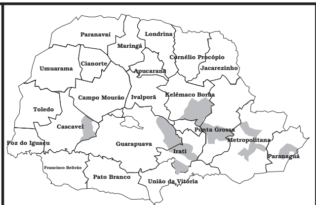
Figura 1B - Loxosceles laeta