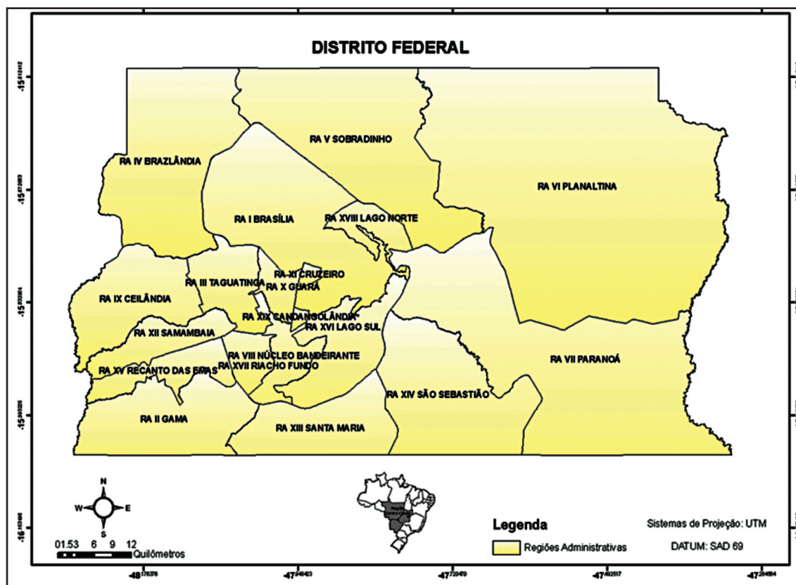
FIGURA 1 - Localização do Distrito Federal.

Foram realizadas observações na região administrativa de São Sebastião onde foram visitados os lugares das zonas urbana e rural onde ocorreram mais casos de hantavirose e onde foram capturados os roedores portadores do vírus. Essa etapa tem como objetivo de coletar as informações referentes ao uso do solo em áreas com ciclo