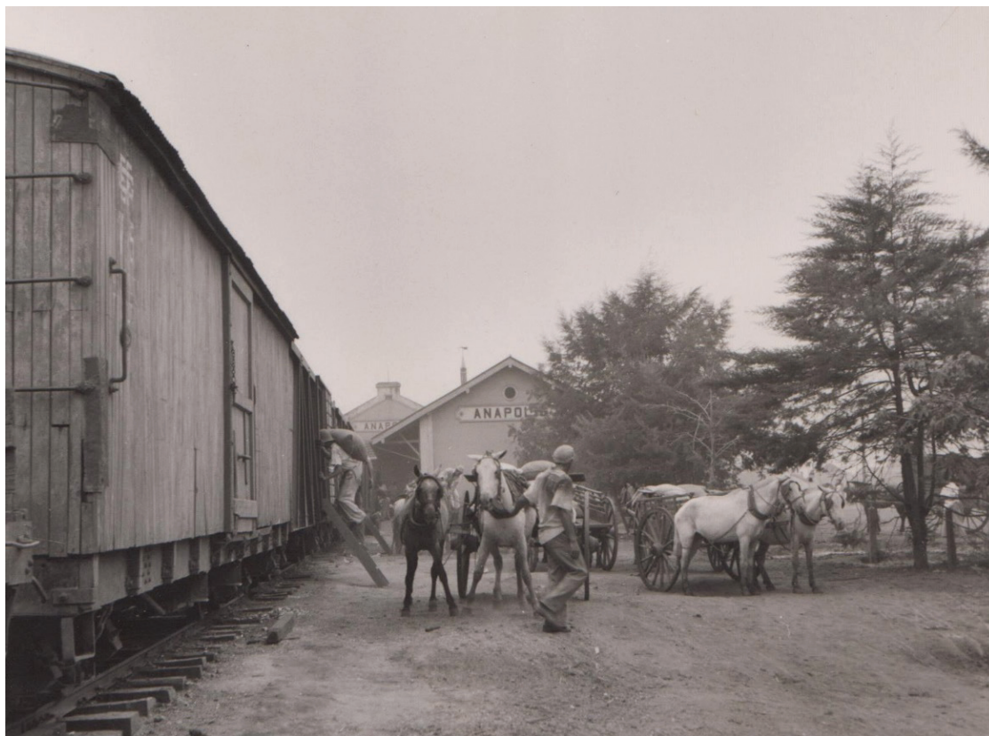
Figura 2: Carregando arroz em armazém anexo à estação ferroviária em Anápolis, Goiás

No dia 24 de janeiro de 1952, Bruman partiu de ônibus de Goiânia para Anápolis, que representava o principal centro de comercialização agrícola do Brasil Central. A conclusão da Estrada de Ferro Goiás (Bruman a denomina Goiás Railroad), em 1935, tinha Anápolis como estação final. Muitas empresas e armazéns agrícolas se instalaram na cidade, estocando e revendendo os produtos agrícolas da região florestada do Mato Grosso de Goiás para o estado de São Paulo, principal centro consumidor do país. Bruman fez um interessante registro fotográfico do abastecimento de arroz na estação ferroviária (Figura 2).