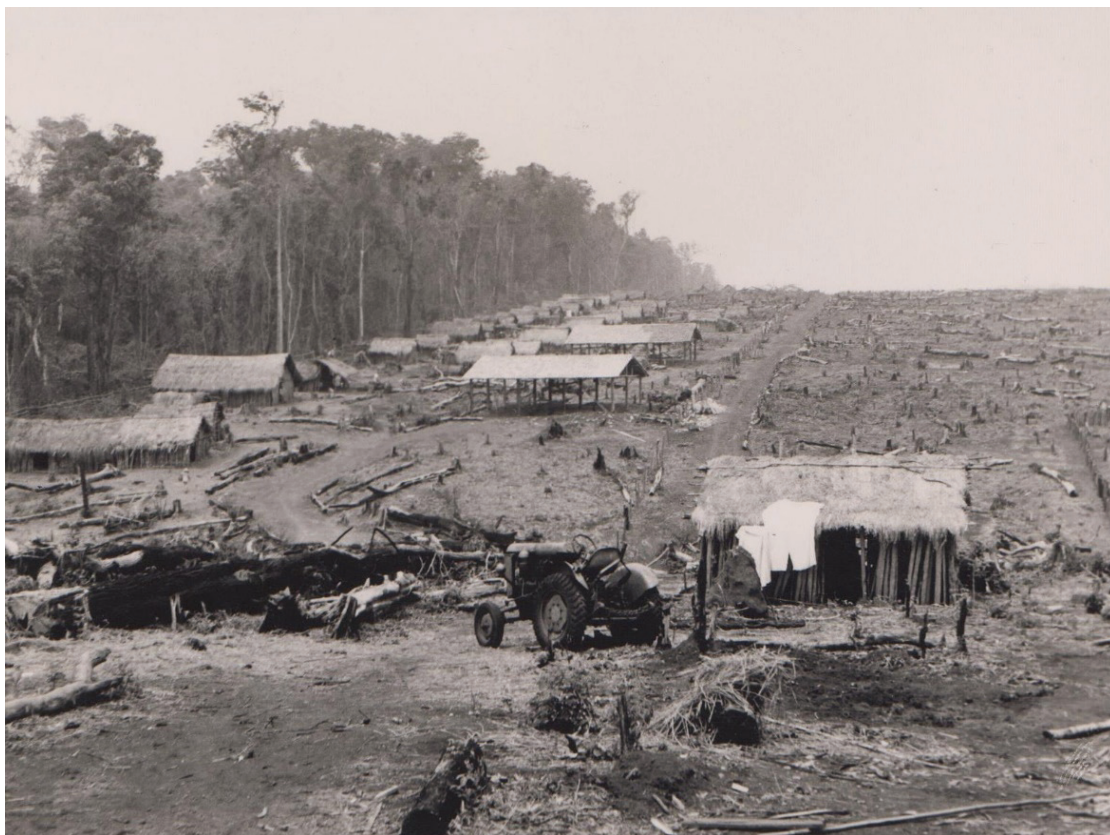
Figura 4: Habitações temporárias de novos colonos em área de assentamento rural próxima à Colônia Agrícola Nacional de Goiás