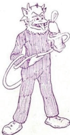
Figura 4: Fon-Fon! Rio de Janeiro, ano III, n. 8, 18 fev. 1909.

Hélio Seelinger ilustra, na Figura 4, igualmente um sujeito endiabrado que aparece sozinho, envolto em sua cauda enorme, que está presa entre as duas mãos. O desenho acompanha, na realidade, uma crônica sobre o carnaval intitulada “Uma ideia do José Gomes”. Trata-se das peripécias carnavalescas de um pai de família respeitado e de grande prestígio social. Nesse enredo, não se faz nenhuma referência à fantasia diabólica, esta só ganha evidência pela ilustração. Na caricatura, a maneira como o rabo é agarrado, sendo levantado até a altura do rosto, é bastante expressiva. Há nessa postura não apenas um modo ostensivo, mas também uma atitude de força e orgulho. A cauda é, portanto, um objeto de poder e de luta. É significativo que as três representações lembrem, em demasia, a descrição que os cronistas e o próprio Lima Barreto fizeram do molde da fantasia. Todavia, os sentidos que a alegoria adquire diferem entre os chargistas, cronistas e o literato.