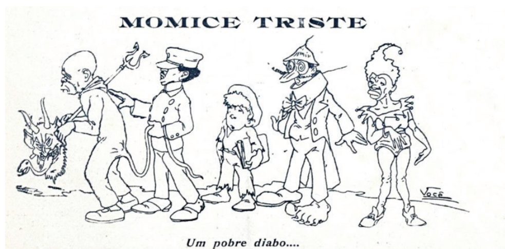
Figura 1: Fon-Fon! Rio de Janeiro, ano V, n. 8, 24 de fevereiro de 1911.