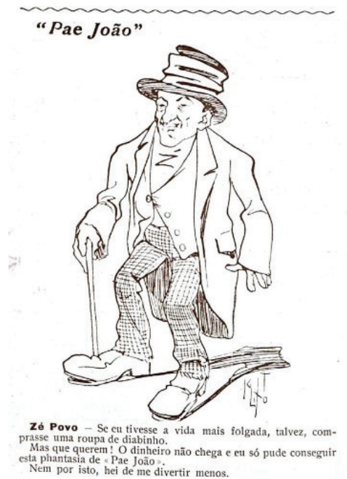
Figura 2: Fon-Fon! Rio de Janeiro, ano III, n. 8, 18 fev. 1909.