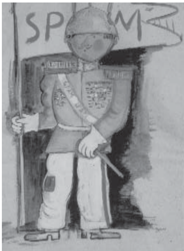
Lasar Segall, O porta-bandeira . Carnaval da SPAM, 1933 [Projeto para figurino]. Aquarela, guache e grafite. Museu Lasar Segall.

um para mil réis) ou concernentes à presença da sociedade civil (imprensa). Todo o espaço está decorado com painéis pintados coletivamente a partir da concepção de Segall. Comparado com a fatura empregada por Segall em outras empresas do gênero – como as decorações do Baile Futurista do Automóvel Club, em 1924, e do pavilhão modernista na residência de Olívia Guedes Penteado, ocasiões em que lança mão de recursos caros às vanguardas européias, como a geometrização de formas abstratas, em que parece querer afirmar a diferença de que era portador –, há uma atenuação da geometrização visando a lograr o efeito de figuração de uma cidade; a gama de tonalidades empregadas apresenta variações em que predomina o ocre. Os desenhos de formas simplificadas e corte expressionista têm grande força expressiva graças sobretudo aos dados irreverentes que incorporam: o porta-bandeira usa uma caçarola invertida como chapéu, escovões servem de ombreiras aos soldados, na vestimenta das autoridades há uma textura e um caimento que lhes empresta ares de mendigo.