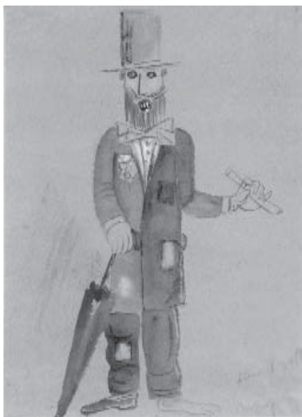
Lasar Segall, O prefeito. Carnaval da SPAM, 1933 [Projeto para figurino]. Aquarela. Museu Lasar Segall.