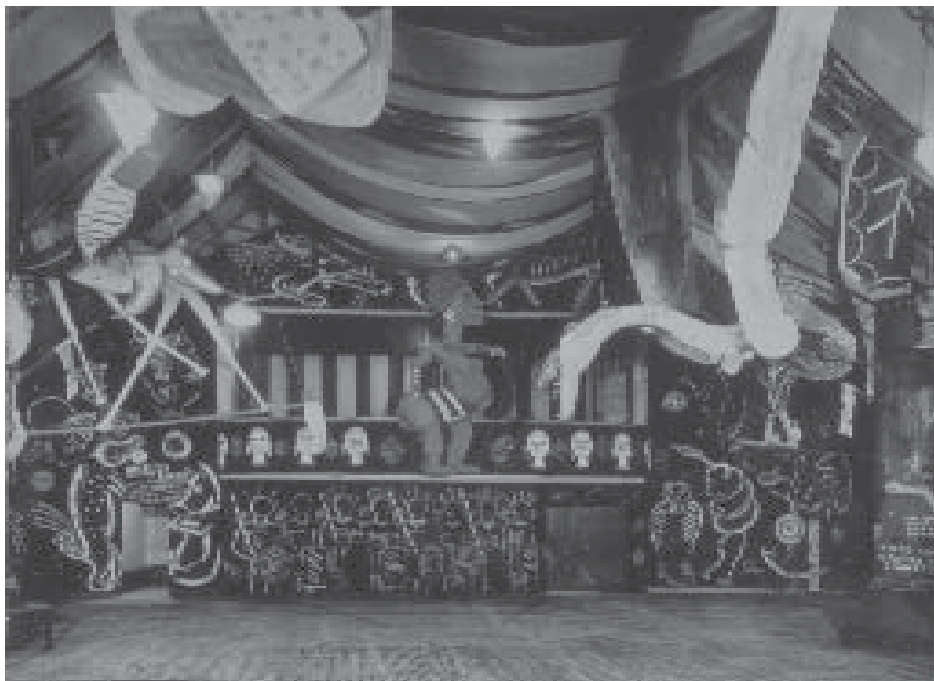
Lasar Segall, Expedição às matas virgens de Spamolândia [Decoração do baile de carnaval da SPAM], 1934. Museu Lasar Segall.