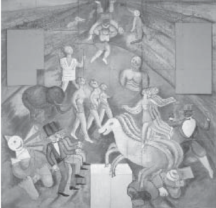
Lasar Segall, O circo . Carnaval da SPAM, 1933. Pintura guache. Museu Lasar Segall.

Nesses termos, a iconografia da cidade spamista revela ambigüidades presentes no posicionamento social do grupo responsável por ela. De imediato, é possível ler aí elementos de crítica à ordem social: a graça com que os marginais são retratados os aproxima das autoridades que sofrem um rebaixamento visual; a convocação para a festa sugere, a partir mesmo da onipresença das manifestações artísticas como marcadores da sociabilidade, certa anarquia que tende a invalidar a hierarquia tradicional, reforçada pelo clima onírico que deriva do conjunto das representações mobilizadas. Contudo, o viés crítico jamais avança sinalizando na direção de um horizonte de rompimento ou sequer de uma transgressão real dos padrões estabelecidos de vida social. Para aquilatar convenientemente tal interpretação, cumpre isolar as determinações próprias de qualquer festa daquelas específicas de um baile de carnaval e, finalmente, de um baile de carnaval da SPAM.