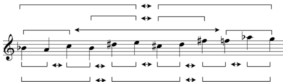
Figura 8: Série do Op.28, A. Webern com indicação de células simétricas.

A operação básica efetuada por Webern é suficientemente conhecida – a partir do Op.21 ele introduz eixos de simetria que imprimem uma espécie de funcionalidade na série, que será manifesta de acordo com o eixo que guiar a figuração. Um exemplo claro do aproveitamento desses eixos é o segundo movimento do Quarteto de cordas Op.28, cuja série é apresentada a seguir: