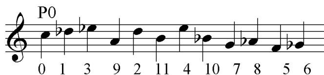
Figura 1: Série Original da Suíte Op.25 – A. Schoenberg.

A primeira peça analisada por BOSS é o Prelúdio da suíte para piano, Op.25. A série original utilizada na obra é a seguinte: