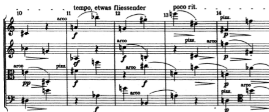
Figura 9: Anton Webern, Quarteto Op.28, segundo movimento, c.10-14.

parte ele trabalha, em relação às simetrias, sob certa neutralidade. Nenhum tipo de simetria é explicitamente privilegiado na percepção, com exceção de algumas figuras de 2 notas delimitadas por ligaduras, sobretudo entre os c.10 e 14 da primeira parte, por exemplo, que sempre se relacionam por cromatismo: