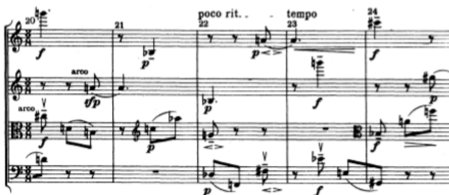
Figura 10: Anton Webern, Quarteto Op.28, segundo movimento, c.20-24.

Na segunda parte ele altera o procedimento, e passa a privilegiar claramente a partição da série em células de 3 notas. Como pode ser visto na Figura.10 a seguir, entre viola e violoncelo há um jogo claro entre figuras de 3 notas que manifestam simetrias: