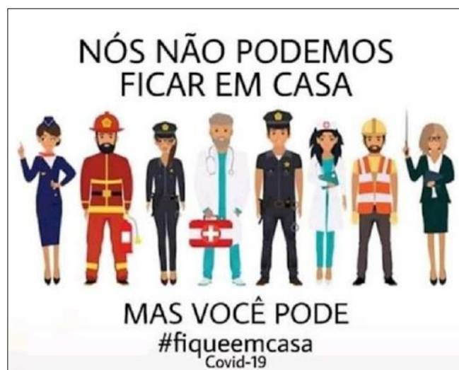
Figura 4 – Campanha em redes sociais: “#Fiqueemcasa”

O “Fique em casa” das campanhas sobre a pandemia é excludente, por vários motivos: primeiro, porque nem todos podem ficar em casa devido à natureza de seu trabalho; segundo, porque nem toda casa é sinônimo de isolamento; terceiro, porque nem todos têm casa. O “cenário” evocado na Figura 3, cenário que reportamos ao drama, é burguês, porque contempla os desdobramentos da pandemia apenas para determinado grupo social, adequado às normas vigentes na sociedade disciplinar.