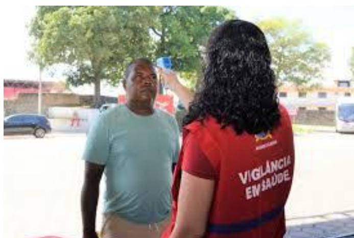
Figura 6 – Termômetro infravermelho em uso (2)