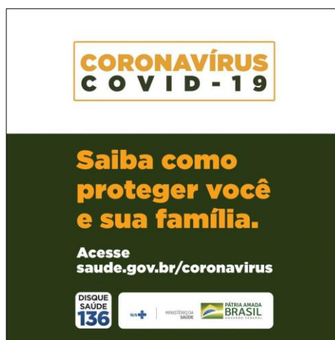
Figura 1 – Peça publicitária estatal: “Saiba como proteger você e sua família”

Na Figura 1, observa-se a presença desse poder individualizado, que se opera no corpo e na dimensão particular do indivíduo. No enunciado “Saiba como proteger você e sua família”, há um efeito de performatividade (INDURSKY, 1998) que implica uma posição-sujeito de poder e uma posição-sujeito subalternizada, ignorante acerca dos cuidados envolvidos na doença e que tem uma família. O caráter estatal da peça publicitária e a pessoalização da mensagem – “você”, “sua família” – indicam que a questão particular é de interesse e da ordem de gestão do estado, mas também que as questões do país também são de interesse e da ordem de gestão individual.