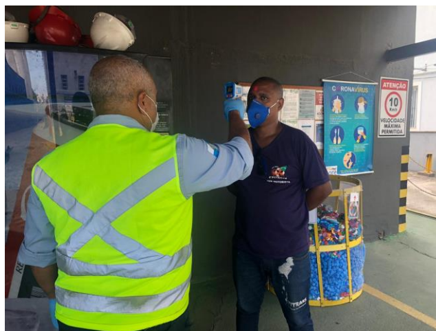
Figura 5 – Termômetro infravermelho em uso

responsáveis, em parte, pelo genocídio do povo negro, a que Abdias Nascimento (2016) chamava atenção desde a década de 1970, e com as cenas de coerção dos países do Norte global contra a imigração de africanos e árabes, alvos também da guerra high-tech .