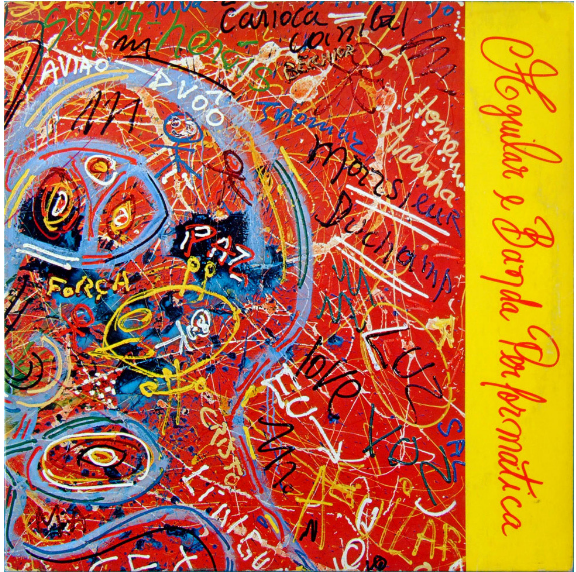
Figura 4. Aguilar e Banda Performática, 1982. LP Stereo, Neon Fonográfica, São Paulo. Produzido por Belchior