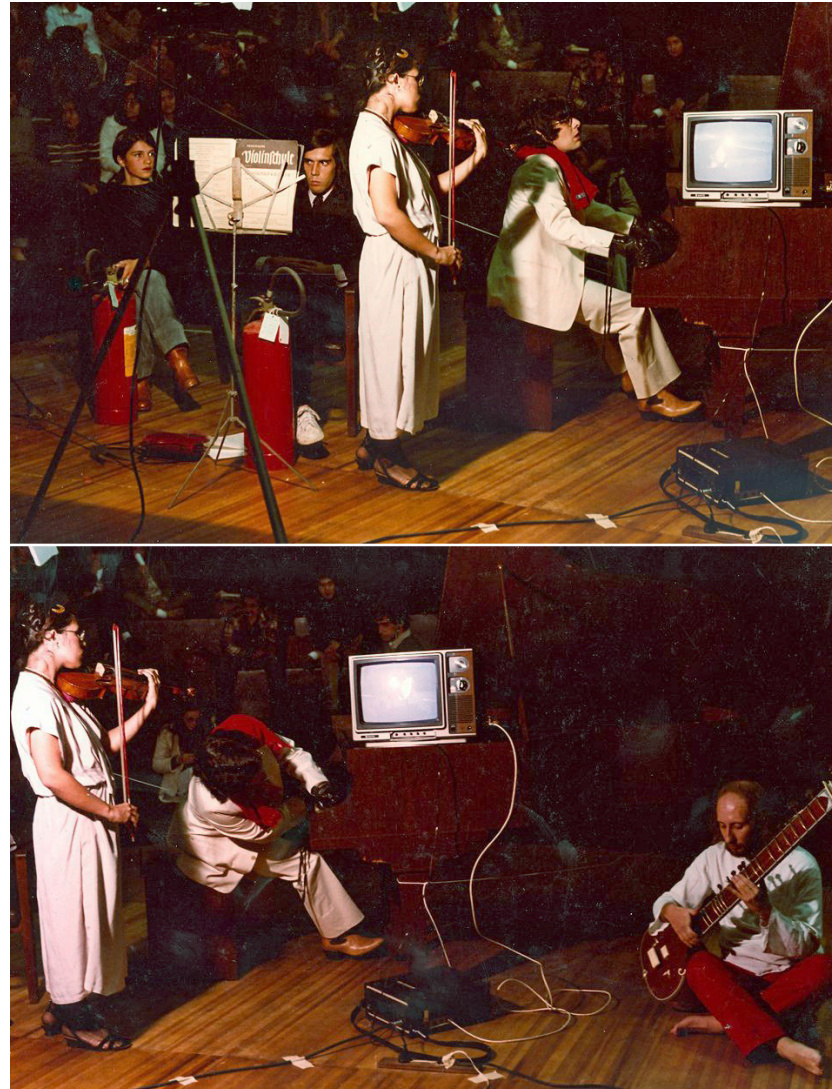
Figura 1. Per 4 – Per Concerto para luvas de boxe, piano, violino, dois extintores de incêndio, cítara, quatro letras formando a palavra ARTE e instrumentos vários, 1980. Pinacoteca do Estado de São Paulo.

intitulada Orelha de Van Gogh – manhã de verão em São Petersburgo e, a partir de maio de 1981, já com o nome de Banda Performática, passa a se apresentar regularmente em espaços culturais do Rio de Janeiro e São Paulo, e também em casas noturnas. 3