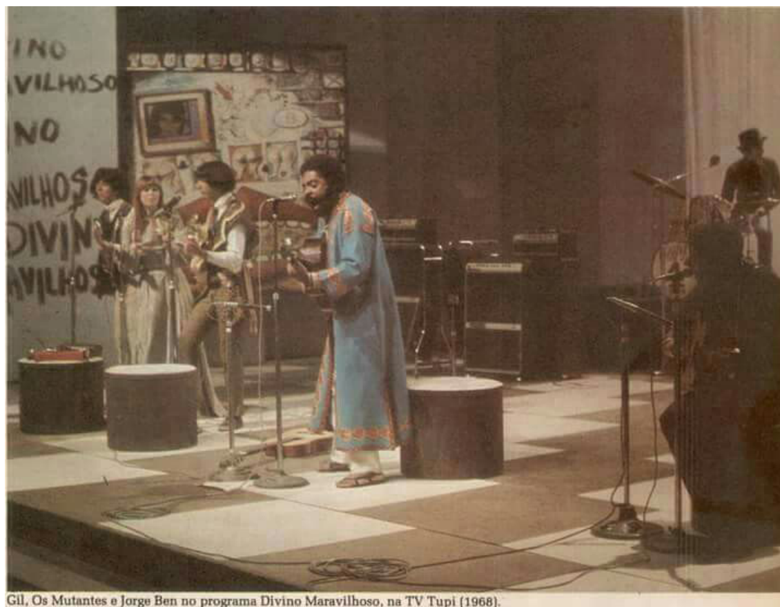
Gil, Os Mutantes e Jorge Ben no programa Divino Maravilhoso, na TV Tupi (1968).

A gravação de um disco pela Banda Performática, implicava, ainda, a transposição da apresentação musical e performática do grupo para um registro de apenas uma das dimensões do trabalho, a dimensão sonora. Na entrevista, a jornalista pergunta, “como é o som de uma coisa que só mesmo vendo? Como é que uma Banda Performática grava um disco?” (GOMES, 1982, n.p.). Ao que os artistas respondem que a banda precisou pesquisar sobre a passagem