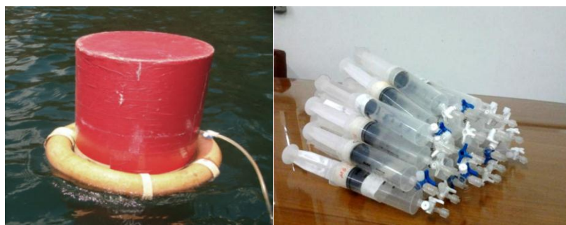
Figura 2. Câmara de PVC e seringas de polipropileno utilizadas nas coletas.

As amostras foram obtidas por meio da técnica de câmara estática (Khalil et al., 1998; Marani e Alvalá, 2007), onde o metano emitido pela superfície da lagoa foi coletado em seringas plásticas de polipropileno com o uso de cúpulas cilíndricas de PVC, com volume de 26 litros e flutuadores de espuma acoplados em sua base para sustentação na água (Figura 2).