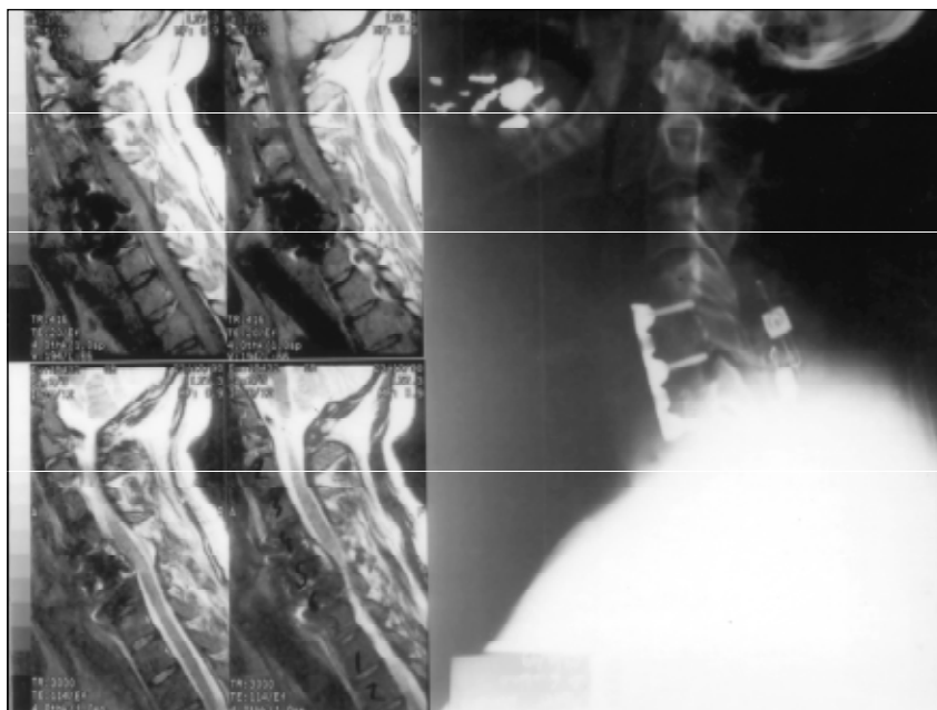
Fig 3. Ressonância magnética mostrando a compressão medular pela "cage" e radiografia em perfil mostrando a fixação anterior e posterior combinada.