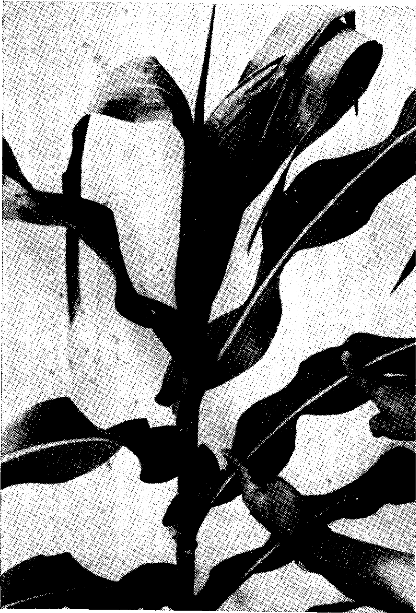
FIGURA 1. — Planta de milho 9 semanas após o plantio. Fôlhas de posição +4 e parte da fôlha indicada para análise. A nervura é usada para a dosagem de nitrato e reserva-se a porção clorofilada para a análise de nitrogênio-total.