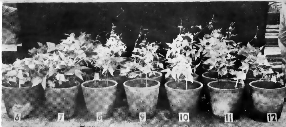
Aspecto das plantas da variedade "Goiano-precoce" com os tratamentos: 6 = 200 g de cudzu verde, no sulco; 7 = 200 g de feijão-de-porcc, no sulco; 8 = 200 g de tremôço misturado com a terra; 9 = 200 g de tremôço, no sulco; 10 = 150 g de tremôço, no sulco; 11 = 100 g de tremôço, no sulco; 12 = Testemunha. Em cima: 15 dias após a germinação. Embaixo: 30 dias após a germinação.