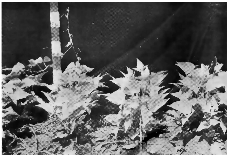
Figura 1. — Aspecto do alongamento do internódio do feijoeiro verificado no ensaio de campo quando incorporada a massa vegetal do terreno ao solo antes do plantio.

No dia 3 de janeiro de 1966, foi colhida a experiência. As análises estatísticas dos dados de produção de sementes bem como de massa vegetal não mostraram diferenças significativas entre os tratamentos estudados.