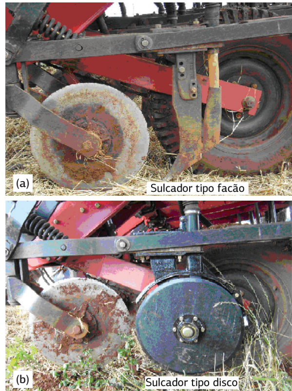
Figura 1. Mecanismos sulcadores utilizados: haste sulcadora (a) e disco duplo desencontrado (b).

e : espaçamento entre régua verticals, cm.