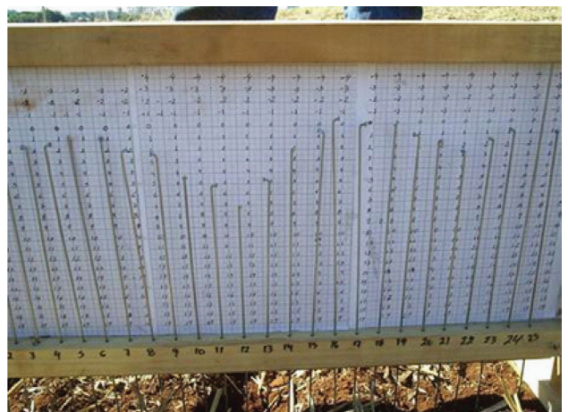
Figura 2. Perfilômetro em madeira utilizado para medida de área de solo mobilizado.