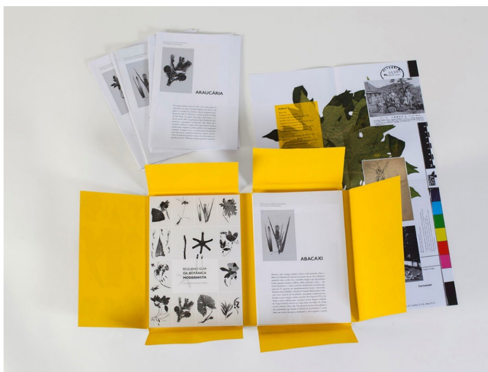
Figura 1 – Projeto gráfico do Pequeno guia da botânica modernista (projeto gráfico de Gabriel Pedrosa).

ferrovias, automóveis e arranha-céus, passam a delinear nossa modernidade; espécies do México e da América Central (como o agave), que falam da busca modernista pelas raízes latino-americanas e ancestrais do Brasil, anteriores à colonização; plantas nobres, que servem para embelezar a grande cidade (como as palmeiras e os plátanos); plantas humildes como o milho – carinhosamente chamadas, em Macunaíma (ANDRADE 2013a), de “plantinhas” ou “plantas boas” –, que alimentam a gente da roça ou da floresta; e até mesmo plantas que, normalmente desprezadas e taxadas de “mato” (a embaúba, a aninga, a tiririca), passam no modernismo a explicitar a dimensão intensa e conflituosa da relação homem-natureza. São árvores, ervas, folhagens e arbustos variadíssimos, que brotam na selva, nas plantações e nos jardins, no solo seco e à beira das lagoas, uns associando-se à volúpia, à exploração e ao desejo de dominação e controle, outros, à fertilidade e à capacidade de resistência.