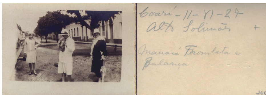
Figura 4 – “Coari-II-VI-27/ Alto Solimões/ Manacá Trombeta e/ Balança”, fotografia de Mário de Andrade. Fonte: Arquivo IEB/USP, Fundo Mário de Andrade, código de referência MA-F-0260

Esse conjunto de textos e imagens não só indica como e quando surge o interesse dos modernistas pela vitória-régia, como demonstra o processo mais amplo de sua transformação em “flor nacional”, um símbolo vegetal contraditório e ambíguo, que traz para o centro do “problema” Brasil uma Amazônia “desgeografizada” e a emergência do feminino como questão, numa associação entre a flor e a mulher que vai além dos clichês acadêmicos (indicando a violência masculina do colonialismo e a força feminina da natureza e dos povos originários que a ele resistem).