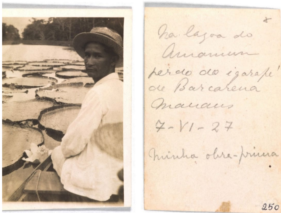
Figura 3 – “Na lagoa do Amanium perto do igarapé de Barcarena Manaus – 7-VI-27 – Minha obra-prima”, fotografia e anotações de Mário de Andrade. Fonte: Arquivo IEB/USP, Fundo Mário de Andrade, código de referência MA-F-0250

A primeira dessas fotografias, segundo anotação do próprio Mário, foi tirada em junho de 1927 na lagoa do Amanium, em Manaus. Faz parte de uma série de imagens que revelam a “descoberta” da vitória-régia ( Victoria amazonica ) pelo escritor modernista, demonstrando o seu deslumbramento inicial (equivalente, quem sabe, ao dos primeiros exploradores europeus que descreveram a espécie no século XIX). Em primeiro plano, um pouco deslocado para a direita e olhando para a câmera, aparece o barqueiro, que divide a composição com as enormes folhas flutuantes da planta e a “flor extraordinária” que surge entre elas. Ao fundo, vê-se a superfície da lagoa e as (apequenadas) árvores da floresta. Se, por um lado, essa fotografia ainda retém uma função documental ao se voltar para “os aspectos da geografia física da região [amazônica], para o homem e a cultura material” (LOPEZ, 2005, p. 143), por outro lado, a função poética emerge no enquadramento pouco usual e na ironia da legenda “Minha obra-prima”, que parece sugerir certa insegurança do escritor ao se fazer fotógrafo e sua consciência de que a fotografia não deixa de ser uma apropriação da imagem da flor, obra-prima da natureza.