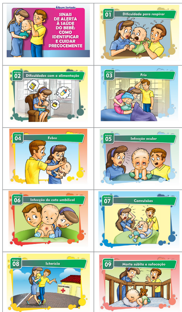
Figura 1 – Protótipo da versão do álbum seriado “Sinais de alerta à saúde do bebê: como identificar e cuidar precocemente”, Fortaleza, Ceará, Brasil, 2020

Para a composição da amostra, utilizou-se a numeração ímpar de sujeitos para evitar empates nas respostas e questionamentos dúbios, além de ser o quantitativo sugerido por Pasquali (18) . Assim participaram 11 mães de crianças menores de 2 meses de idade em acompanhamento ambulatorial durante a consulta de follow up . Aquelas mães que apresentassem diagnósticos psicológicos e/ou psiquiátricos (depressão pós-parto, baby blues , transtornos de humor, doenças neurológicas) ou dificuldade de compreensão e expressão verbal que as impossibilitassem de participar da intervenção educativa ou de responder aos instrumentos seriam excluídas da pesquisa.